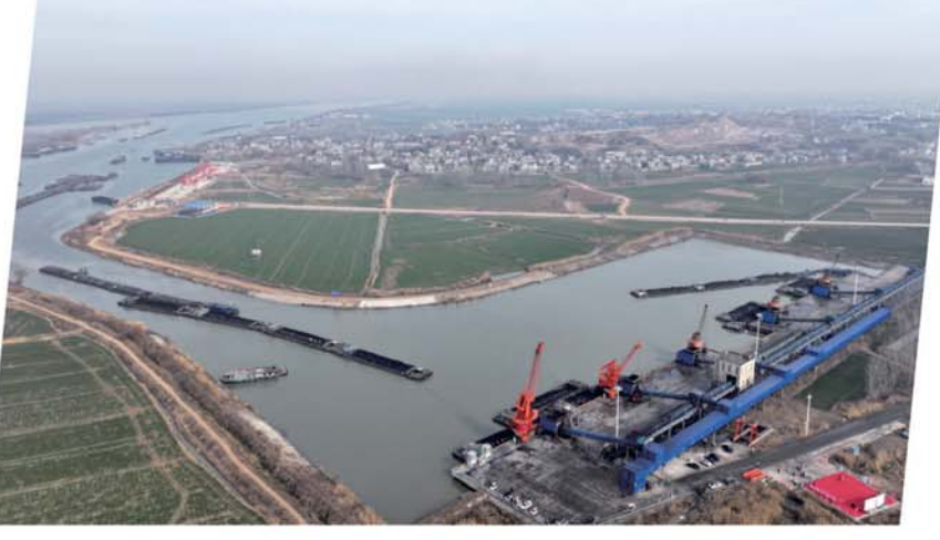
国能黄碾窑码头三期项目