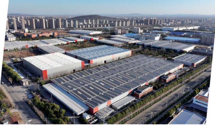
东方机电年产8万吨铝铸件新能源绿色铸造项目