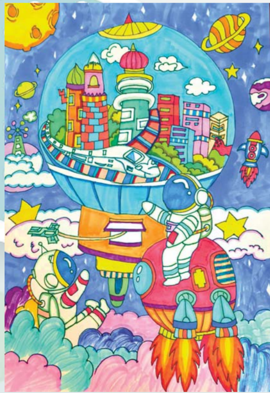
南山郇都小学 四(3)班 薛千粟