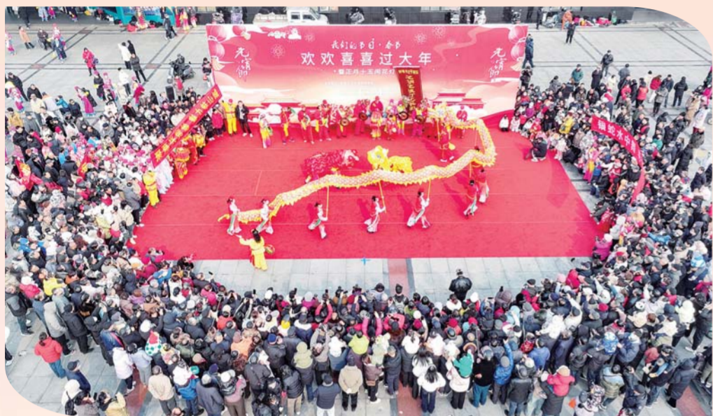
元宵节上午，“我们的节日·春节”暨正月十五闹花灯文艺演出在淮河文化广场热闹上演。