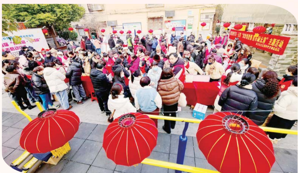
2月12日，黄庄街道举办首届“红馨圆·邻相融”积分集市活动，居民进行积分兑换，互祝元宵快乐。