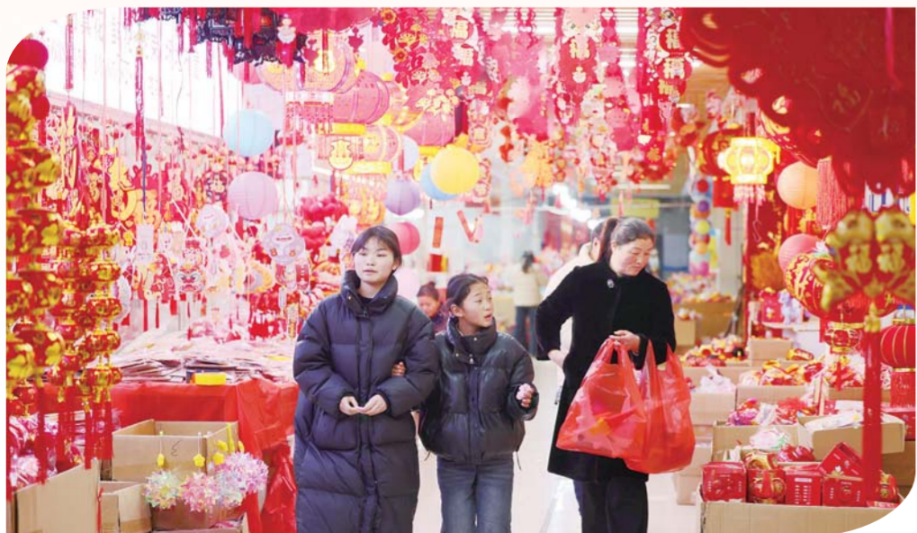
中恒蚌埠义乌国际商贸城，市民选购元宵节花灯。