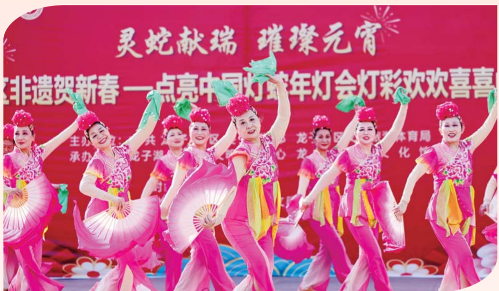
2月11日，龙子湖区新时代文明实践广场，2025年龙子湖区非遗贺新春——点亮中国蛇年灯会灯彩欢喜喜闹元宵展示活动举行。