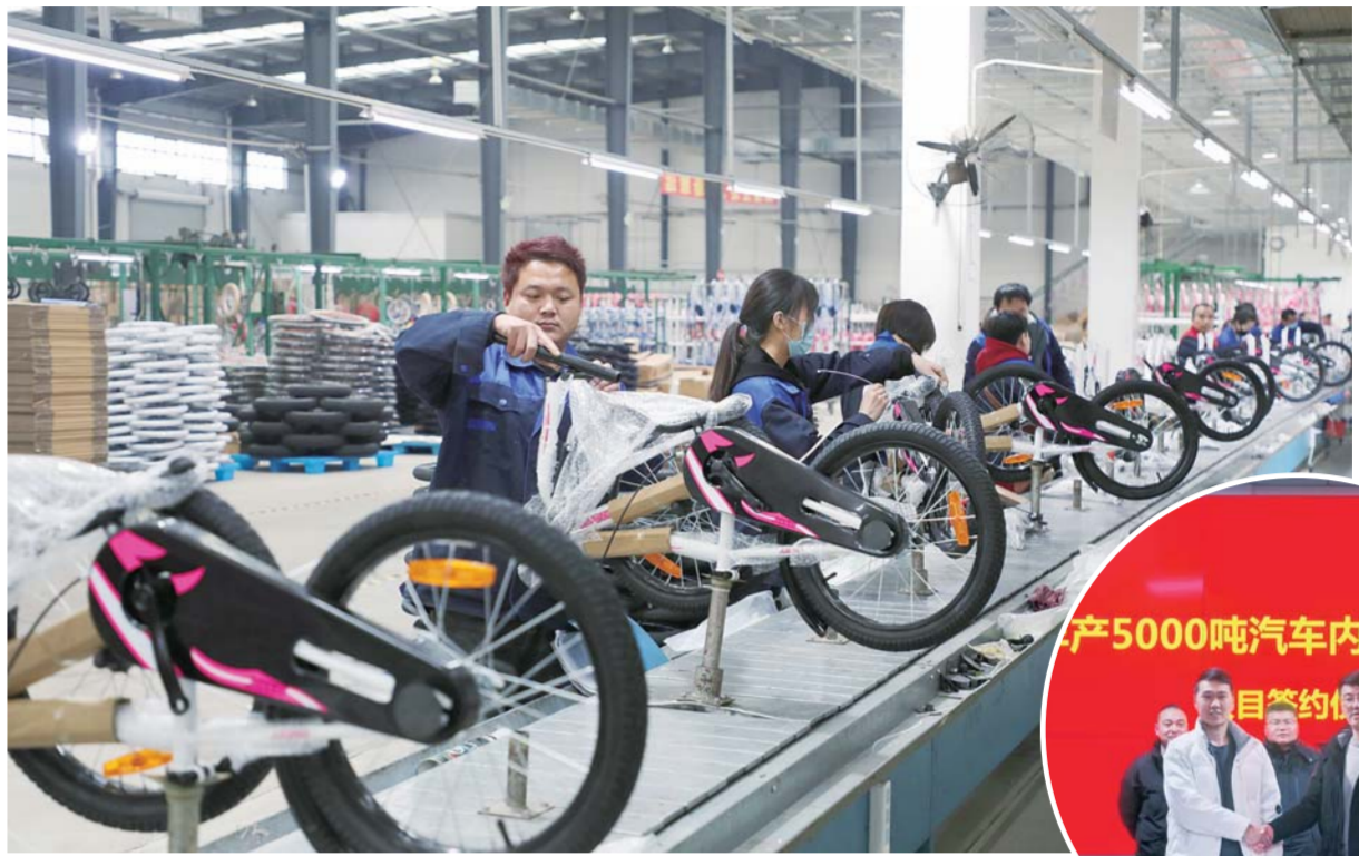
▲五河各企业铆足干劲抓生产，抢订单，吹响“开门红”冲锋号。

未来，五河县将继续坚持“项目为王”理念，以更大力度、更实举措抓好招商引资，持续擦亮“五来办”品牌，营造更优营商环境，全力跑出项目建设“加速度”，为实现“开门红”、夺取“全年红”注入源源不断的强劲动力。