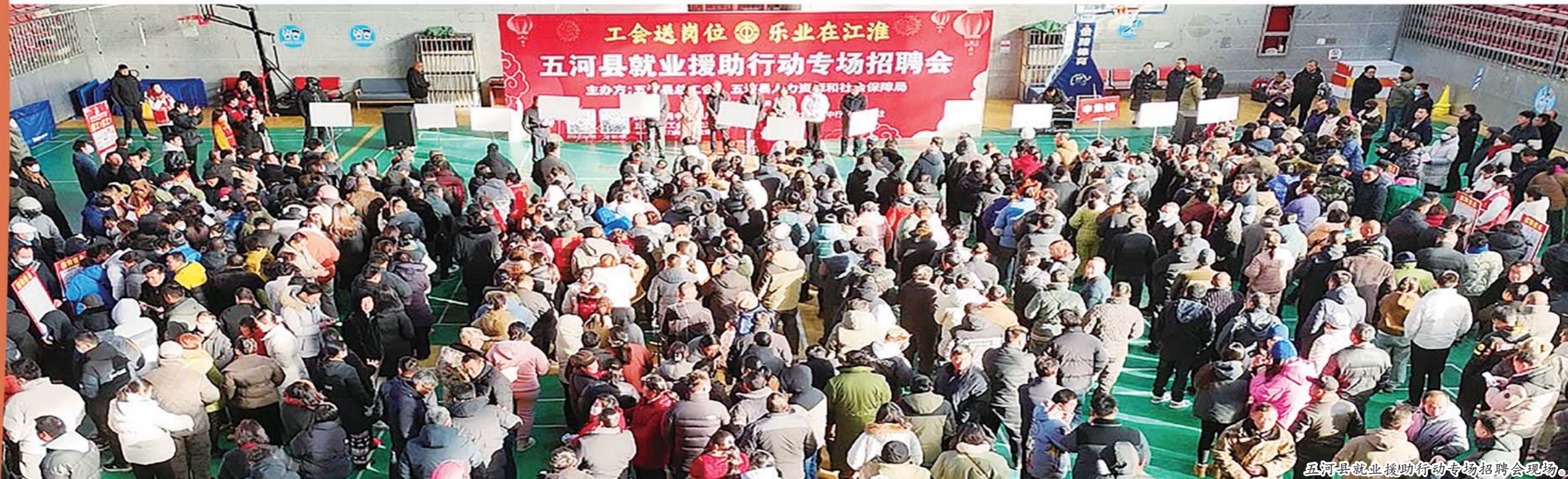
五河县就业援助行动专场招聘会现场。

眼下，出征战鼓已擂动，冲锋号角已吹响，全县上下要拿出攻坚克难的信心，坚定奋力赶超的决心，坚定扛起建设“现代化美好五河”使命任务，向新而行、向高而攀，让春天播下的种子转化为高质量发展的累累硕果。