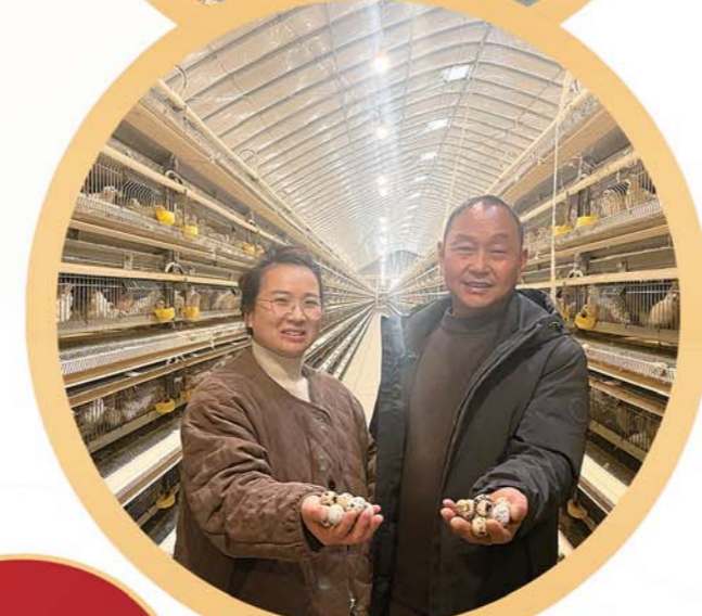
小小鹌鹑带来大希望。