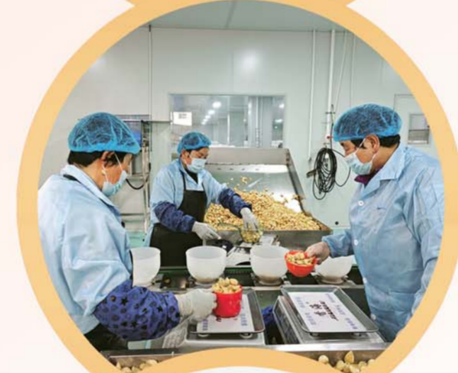
糖蒜加工厂内工人正在忙碌。