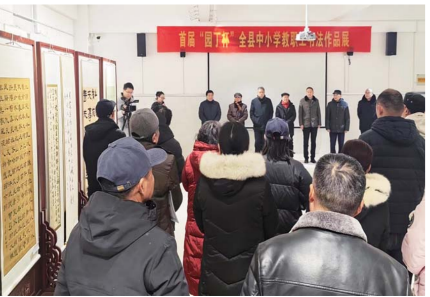
日前,固镇县首届“园丁杯”全县中小学教职工书法作品展举行,活动由县关工委、县教育局主办,五小教育集团谷阳路校区承办。

烟花虽绚丽,健康更重要。根据《蚌埠市人民政府关于加强2025春节期间烟花爆竹燃放安全管理的通告》,在全市禁止燃放区域内,全年禁止任何单位和个人生产、经营、燃放任何种类烟花爆竹;违规燃放的,将依法承担相应的法律责任。 《一封信》向广大经营者发出以下倡议,请广大经营者理解支持禁放工作,请勿在禁放区域燃放“开业炮”“喜庆炮”;争做禁燃禁放的践行者、宣传者、监督者;不无证经营、储存烟花爆竹;若发现违规经营、燃放烟花爆竹行为的,请及时向应急或公安部门举报。