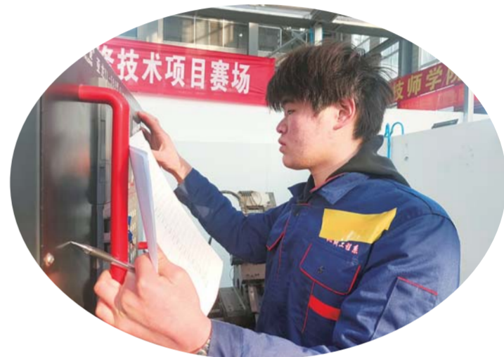
选手在数控机床装调与维修技术赛中。

1月10日-12日,由安徽省教育厅、省工业和信息化厅、省人力资源和社会保障厅、省残疾人联合会联合主办,蚌埠技师学院(蚌埠科技工程学校)承办的2024-2025年度“中银杯”安徽省职业院校技能大赛(中职组)焊接技术(教师赛)、焊接技术(学