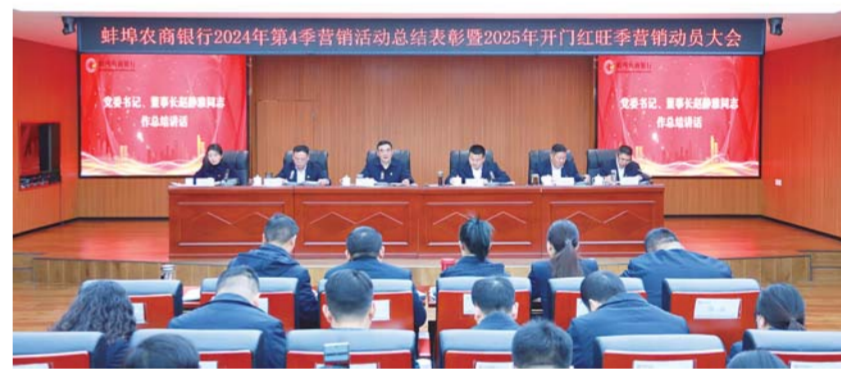
1月10日上午,蚌埠农商银行召开2024年第四季营销活动总结表彰暨2025年开门红旺季营销动员大会,为

关注。同时,每季度举行的“投资怀远行”活动也让更多人了解了怀远的发展潜力和投资环境。 目前,通过以商招商、乡情招商、产业链招商,怀远已形成“人人都是招商能手”的浓厚氛围。据统计,去年,怀远县新签约亿元以上招商引资项目达到了103个。此外,怀远县还加强了对招商项目的全生命周期管理服务,总投资50亿元的博宠食品产业园等34个项目实现了当年签约、当年开工,为工业经济跨越式发展不断注入新的动能。