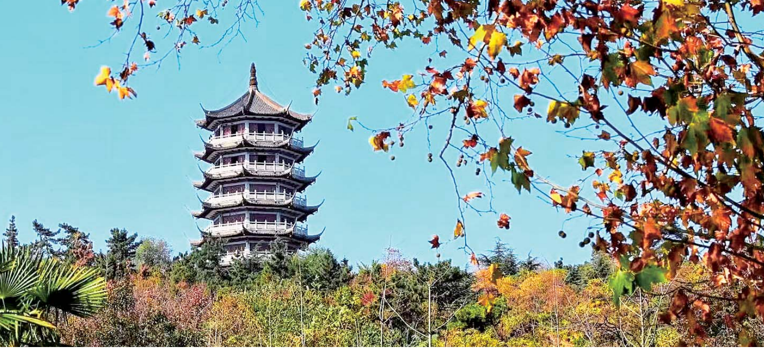
冬日望淮塔

“放管服”，就是简政放权、放管结合、优化服务的简称。这是党的十八大以来深化行政体制改革、推动政府职能转变的一项重大举措。党的二十届三中全会提出：“深化投资审批制度改革”要以钉钉子精神，向“改”求“优”，强化担当作为，攻坚克难，创新以企业满意度为导向的长效机制和营商模式。