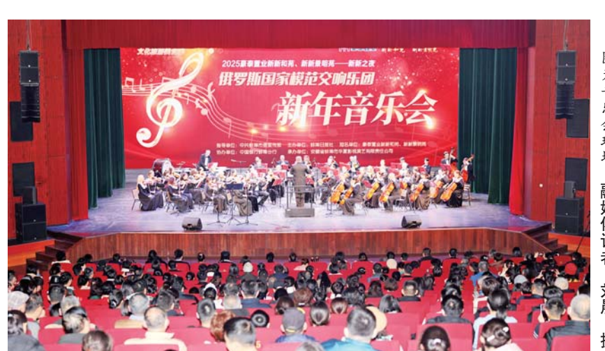
图为音乐会现场。