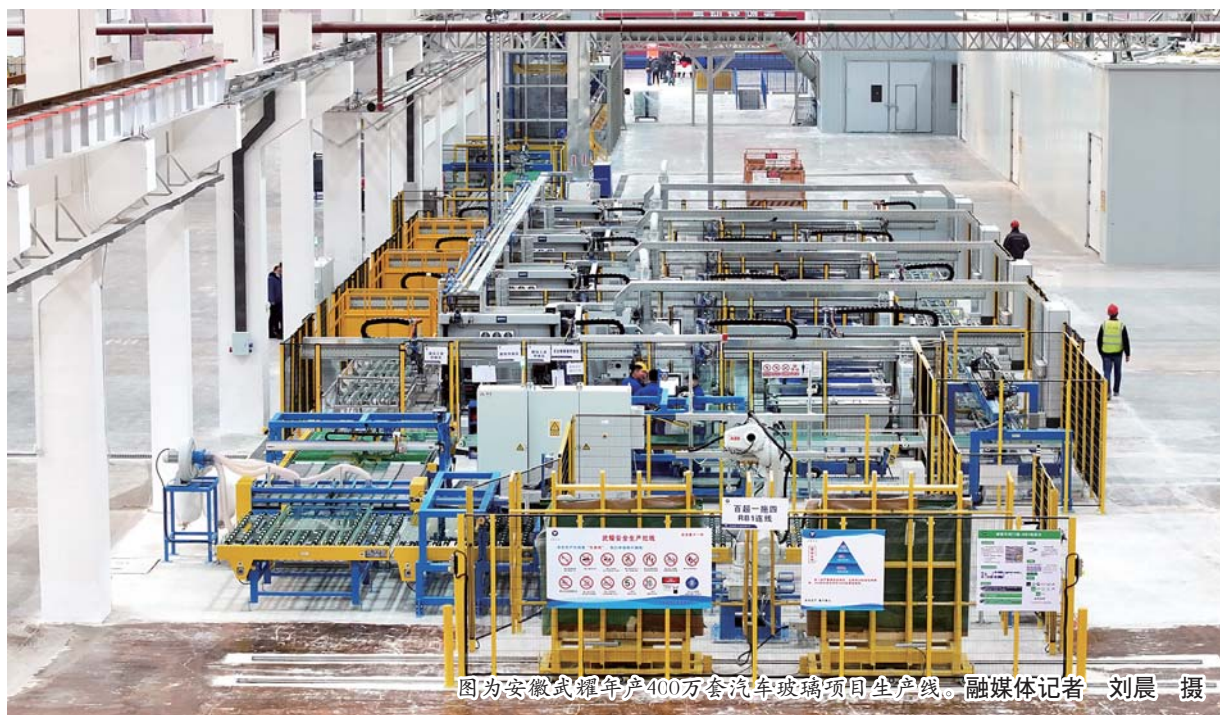
图为安徽武耀年产400万套汽车玻璃项目生产线。

记者从蚌埠高新区了解到,当前,该项目一期进展顺利,现阶段购置了9台角窗注塑机、门玻等设备,已布局代表玻璃制造行业先进水平的智能化生产线,总投资超1亿元,产品已配套合肥比亚迪、奇瑞等车企,完成销售收入超2200万元,实现当年开工、当年投产、当年入规。同时总投资超1.5亿元