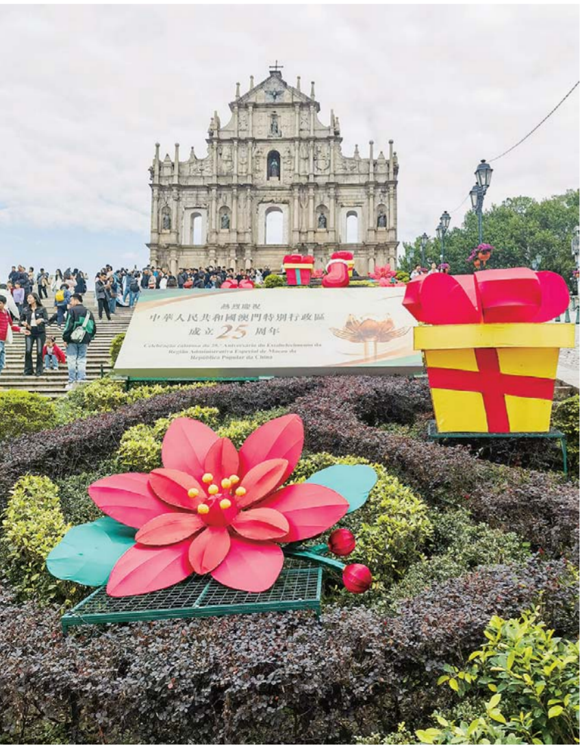
澳门大三巴牌坊前摆放的庆祝布景(12月18日摄)。新华社记者 赖向东 摄