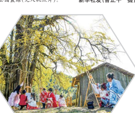
11月28日，江西省宜春市铜鼓县三都镇大槽村银杏树下，第四幼儿园的小朋友在老师的指导下写生。