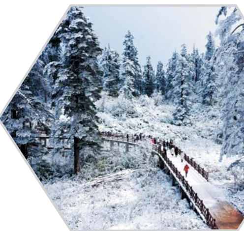
11月28日，四川省眉山市洪雅县瓦屋山景区。