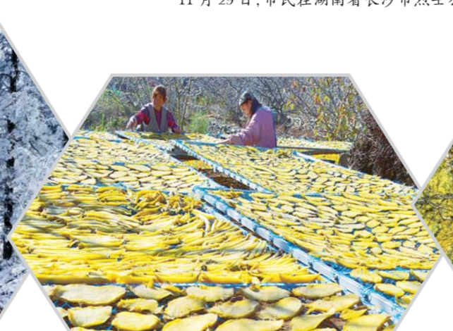
11月30日，山东省枣庄市山亭区水泉镇倪山口村农民在晾晒地瓜干。