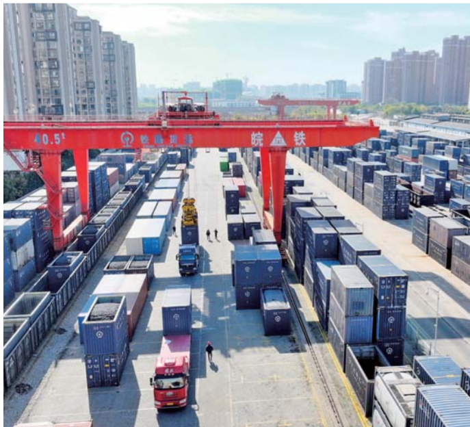
蚌埠货运中心蚌埠（皖北）铁路无水港。（无人机照片）