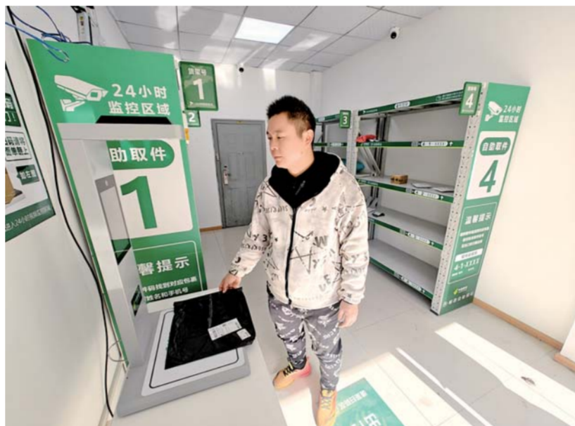
11月26日，市民从位于长乐路的邮政无人驿站里取出快递。