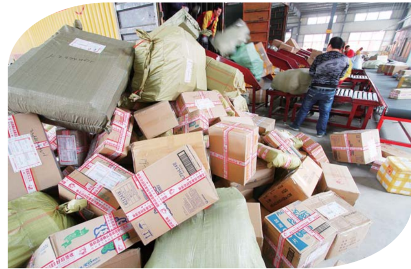
近日，淮上区一家快递公司正在卸货。