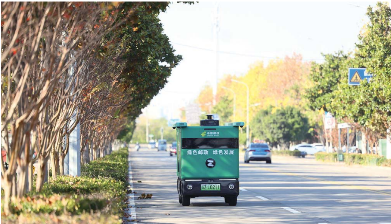
11月26日，邮政快递无人车载着货物在市区道路行驶。