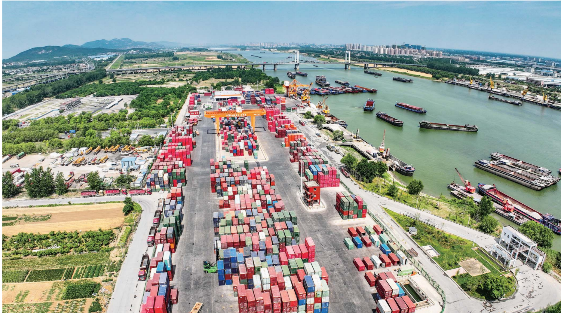
千里淮河第一港蚌埠港集装箱码头。（无人机照片）