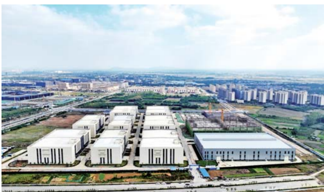
正在建设的蚌埠综保区。（无人机照片）