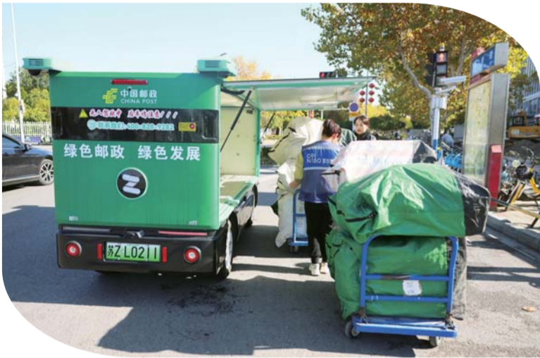
11月26日，学府路，莱乌驿站工作人员从邮政快递无人车上卸载货物。