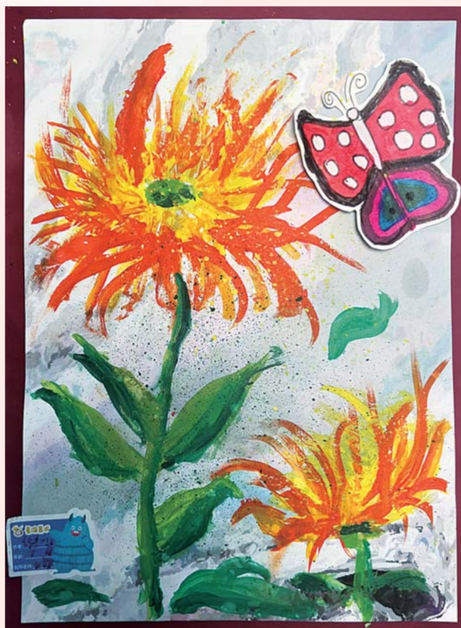
一实校小学部 二(2)班 倪一清