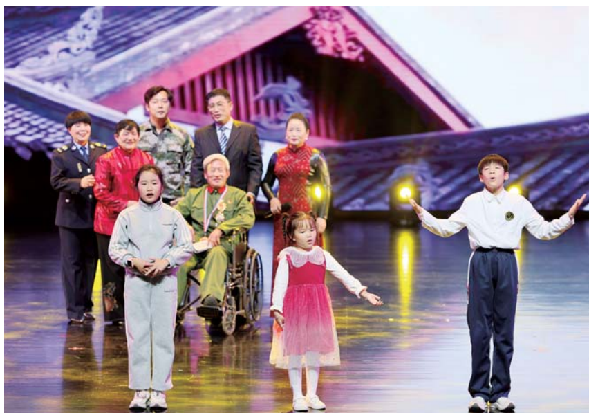
11月2日,蚌埠文化剧场,2024第六届蚌埠家庭文化季暨幸福家庭情景剧展演活动在此举行。