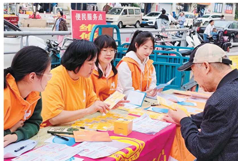
日前,蚌埠市恒心社会工作服务中心、中国人口福利基金会黄手环行动蚌埠市合作团队的志愿者们,在二钢社区为有需要的老年人免费发放微信防走失手环。