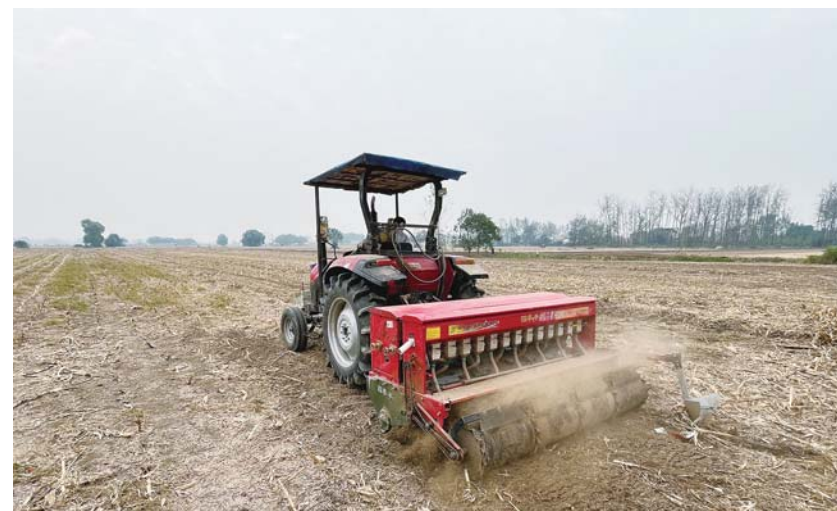
固镇县仲兴镇在2024年秋种工作中,立足确保粮食安全,提早谋划,组织农机检修和农事准备,宣传培训小麦栽培技术,提高群众秋种认识,及时播种。目前,仲兴镇已投入播种机160台套,播种小麦2万余亩,争取在10月20日前基本完成全镇15.7万亩小麦播种任务。