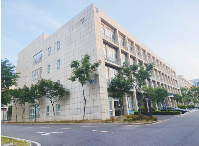
海勤科技的每一道工序都在这栋楼里进行。

据蚌埠智致欣恒城市运营管理有限公司统计,截至目前,蚌山区4个园区已有21家工业企业实现“工业上楼”,使用面积约214亩左右,企业所在园区建筑总面积超31万平方米。