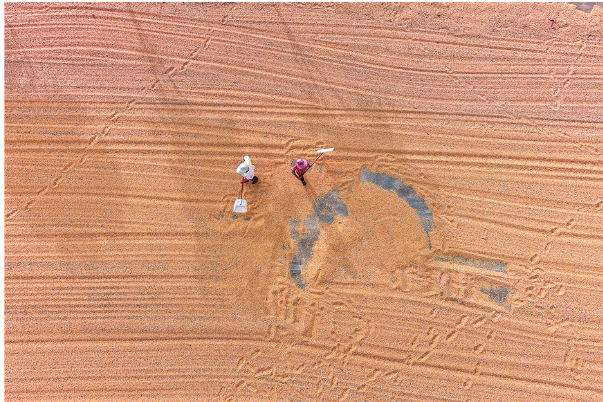
近日,五河县头铺镇农民正在晾晒刚刚收获的玉米。

“秋收秋种关系粮食安全,是国之大事,我们将不断推进‘藏粮于地、藏粮于技’战略,统筹整合资金开展高标准农田建设,进一步提升农田质量和产能。”市农业农村局局长李勇表示,截至目前,全市已累计建成高标准农田428万亩,占耕地面积的74.6%,占永久基本农田面积的87.8%。