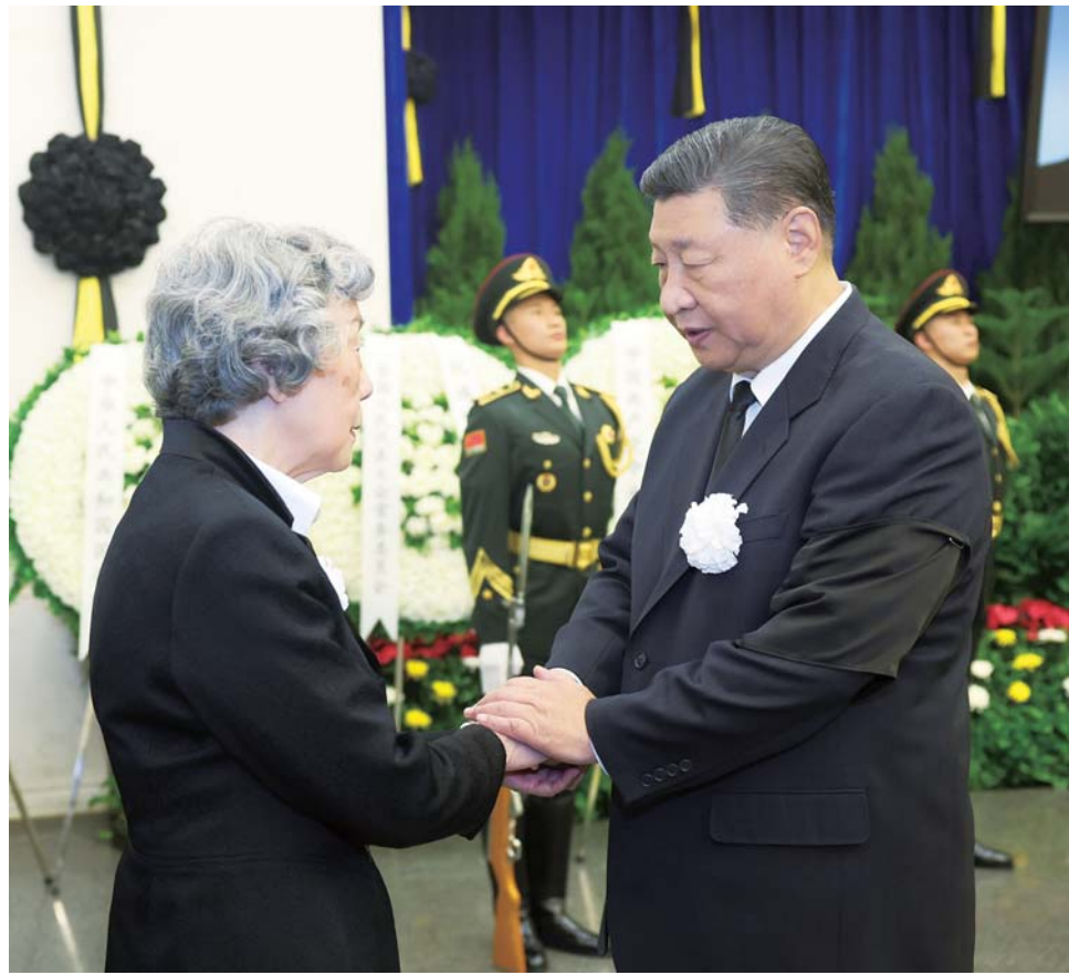
10月14日,吴邦国同志遗体在北京八宝山革命公墓火化。习近平、赵乐际、王沪宁、蔡奇、丁薛祥、李希、韩正等前往八宝山送别,胡锦涛送花圈表示哀悼。这是习近平与吴邦国亲属握手,表示深切慰问。

新华社北京10月14日电 中国共产党的优秀党员,久经考验的忠诚的共产主义战士,杰出的无产阶级革命家、政治家,党和国家的卓越领导人,中国共产党第十四届中央政治局委员、中