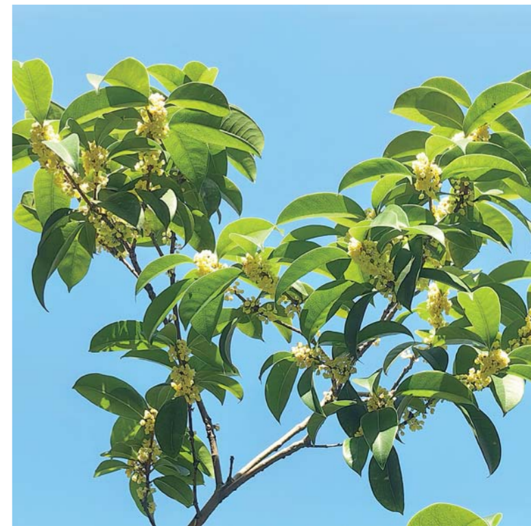
桂花飘香

坚持以基层为重点，为百姓提供就近就便的医疗卫生服务，国家卫健委先后推动三级医院对口帮扶县级医院和“万名医师支援农村卫生工程”。同时，利用5G技术和先进信息网络手段，每年为超1亿人次提供互联网诊疗服务，对服务形式提供了有力补充。 为进一步增强辖区居民的健康保健意识，倡导科学合理的健康生活方式，各大医疗机构纷纷开展系列“义诊进社区 便民暖人心”活动，医务人员到社区免费为居民们提供血压、血糖、心电图等义诊体验服务。特别是在世界癌症日、高血压日、世界防治糖尿病日等健康日节点时，除了到辖区举办定期免费义诊之外，还进行防癌抗癌知识普及、防高血压注意事项等健康保健知识宣传，指导群众养成良好的生活习惯，做到“零距离”服务。 作为医疗专版的新闻编辑，我既是各种医疗惠民政策的坚定传播者，也是推动社会进步和人民福祉提升的见证者和参与者，作为桥梁，我们将积极回应关切，将各类服务惠民政策，及时、准确、全面地传递给读者，为公众的健康事业贡献一份力量。 作者单位：蚌埠日报社