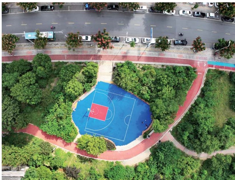
图为虎山口袋体育公园航拍图。

受运动的惬意。此外，还配备了智能化健身器材以及舒适的休息椅凳等设施，充分满足不同人群的运动、健身及休憩需求。 下一步，该公园将定期对设施和锻炼器材进行维护和管理。同时，还将在公园内开展丰富多彩的社区体育活动，积极引导居民多多参与健身活动，尽情享受运动带来的快乐。此外，蚌山区龙湖一村等诸多社区的体育、健身设施提升改造也已陆续完成，为居民提供了更多的快乐健身场地，更好地满足群众的体育文化消费需求。