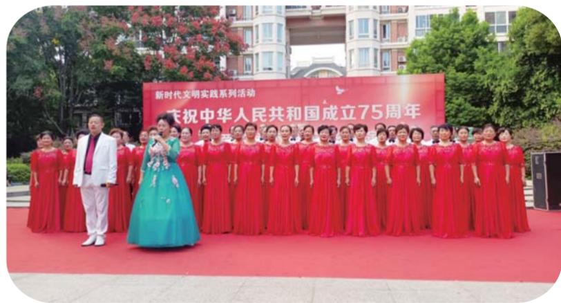
为庆祝中华人民共和国成立75周年,弘扬爱国主义精神,沁雅社区新时代文明实践站联合市文联、沁雅艺术团等开展“爱在社区”文艺汇演活动,为居民带来一场视听盛宴,丰富群众精神文化生活。