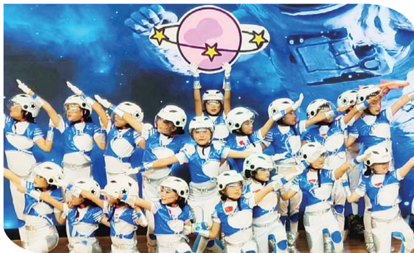
日前,2024年蚌山区中小(幼)“迎国庆”艺术展演举行,来自11所中小学的学生同台展艺,旨在培养孩子们的爱国主义情怀,营造欢乐、祥和的节日氛围。