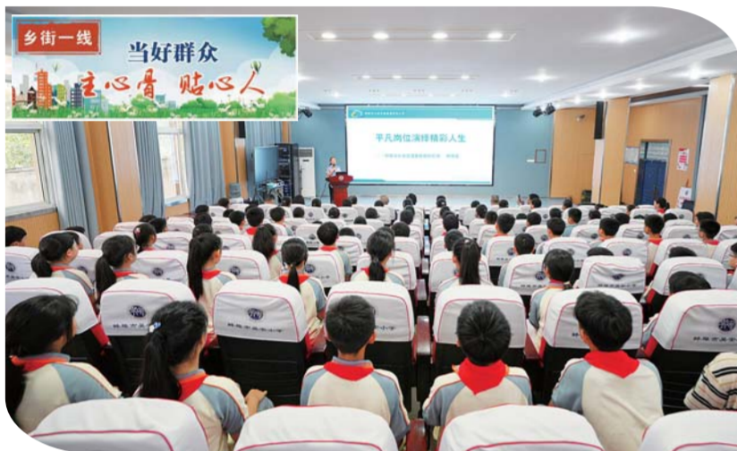
9月26日,淮上区关工委在吴安小学举行庆祝新中国成立75周年活动,邀请全国劳动模范、中国好人、全国三八红旗手杨苗苗到校开展宣讲,全校300余名师生深受启发。