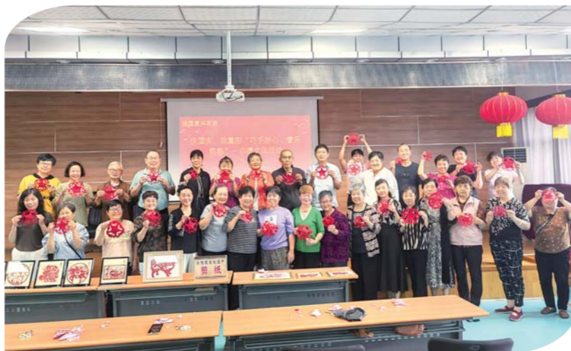
国庆节来临之际,天桥街道老年学校举办剪纸、涂扇制作活动。老年学员们用灵巧的双手剪出生动图案、制作涂扇,表达对生活的热爱和对祖国的深情祝福。