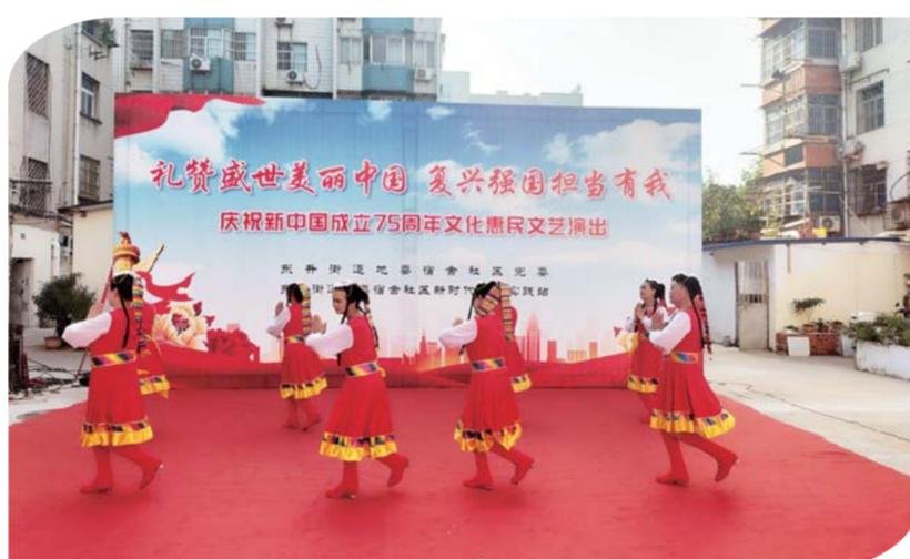
日前,东升街道地委宿舍社区党委、新时代文明实践站举行“礼赞盛世美丽中国 复兴强国担当有我——庆祝新中国成立75周年文化惠民文艺演出”,抒发广大群众爱党爱国爱社会主义、爱祖国、爱家乡、爱亲人、爱生活、爱和平的强烈感情。