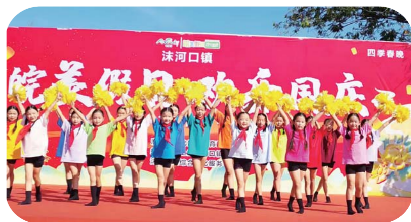
9月28日,淮上区沫河口镇孩子们跳起欢乐的舞蹈《我和我的祖国》,喜迎国庆节到来。