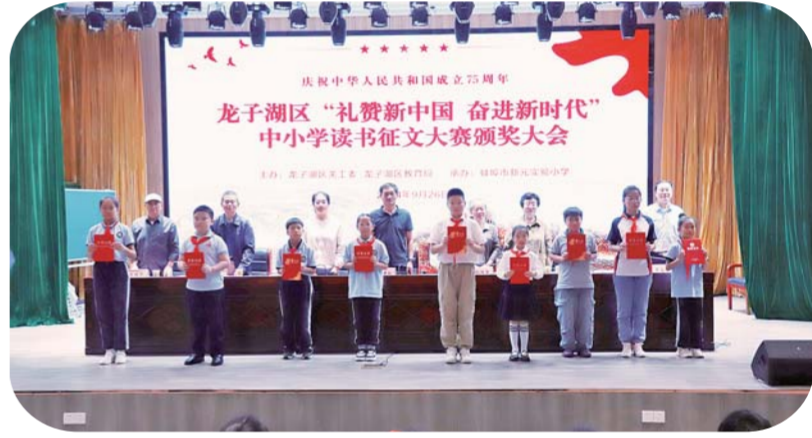
9月26日,龙子湖区关工委、教育局在蚌埠市新元小学举行“礼赞新中国 奋进新时代”中小学读书征文大赛颁奖大会。入选征文从不同视角热情讴歌祖国繁荣发展成就,激发孩子们的爱国情怀和报效祖国坚定信念。