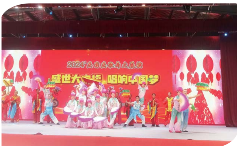
9月28日下午,蚌埠市老龄事业促进会、蚌埠市老年学学会举办“庆国庆大型歌舞展演”活动,表达广大中老年人浓浓爱党爱国情,营造健康向上、团结奋进的氛围。