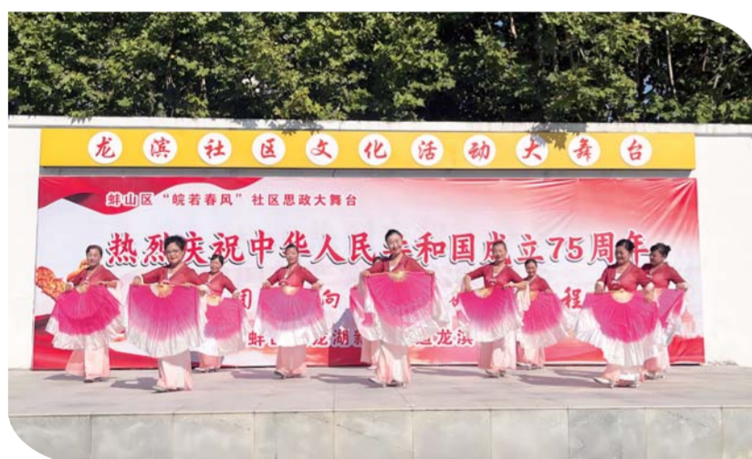
日前,龙湖新村街道龙滨社区新时代文明实践站举办“民族团结心向党 砥砺奋进新征程”庆祝中华人民共和国成立75周年文艺汇演,向伟大祖国献上最诚挚的祝福。