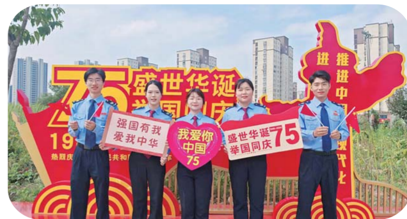
金秋十月迎国庆,税“辉”照耀税务人。近日,固镇县税务局第一税务分局业务骨干以青春之名,赴时代之约,用行动诠释对国家的忠诚与热爱。