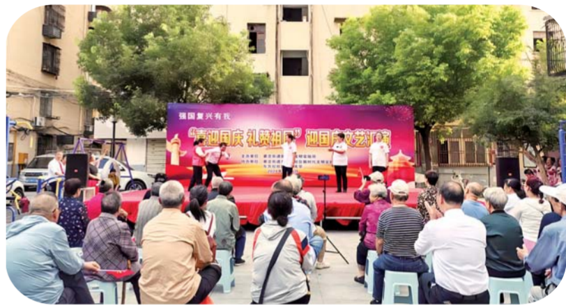
9月26日,黄庄街道东方红社区老年大学在新时代文明实践广场开展“喜迎国庆 礼赞祖国”文艺汇演活动,庆祝中华人民共和国成立75周年,加强群众爱国主义教育,丰富节日文化生活。