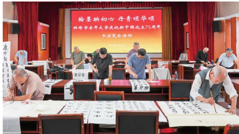
挥笔泼墨向祖国献上诚挚祝福。

此次活动旨在庆祝中华人民共和国成立75周年,弘扬中华优秀传统文化,丰富老年人的精神文化生活,号召大家不忘初心,老有所学,老有所为。