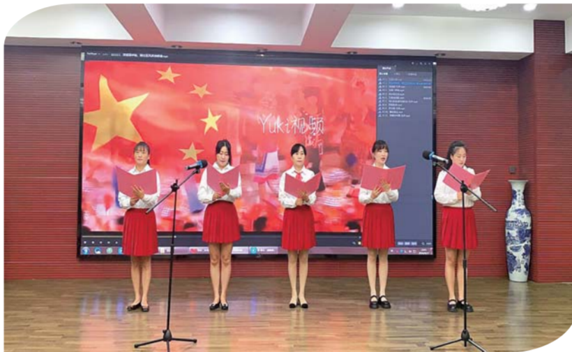
近日,民政家园社区新时代文明实践站在辖区军休二所开展“庆国庆 颂祖国 感恩党”文艺汇演,整场演出形式多样、高潮迭起,为观众带来一场红色精神盛宴,进一步激发群众爱国热情。