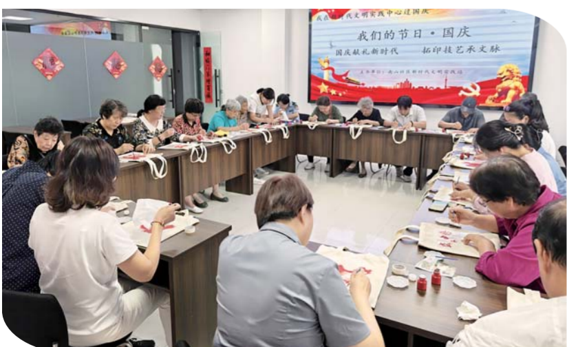
近日,青年街道南山社区新时代文明实践站组织开展“国庆献礼新时代 拓印技艺承文脉”主题活动,向祖国母亲献上一份充满文化底蕴的贺礼。