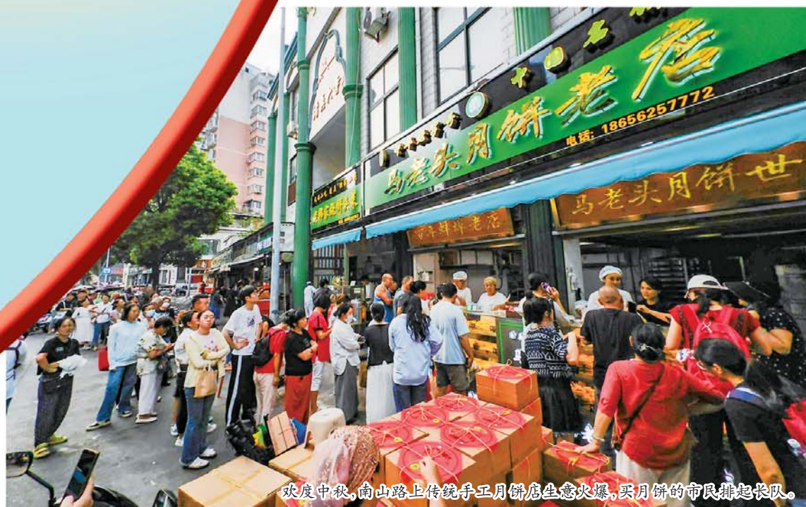
欢度中秋，南山路上传统手工月饼店生意火爆，买月饼的市民排起长队。