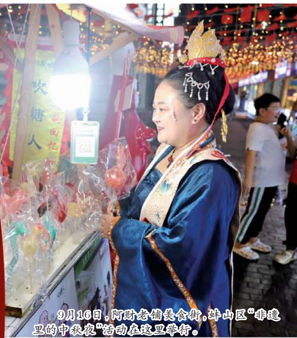
9月16日，阿财老铺美食街，蚌山区“非遗里的中秋夜”活动在这里举行。