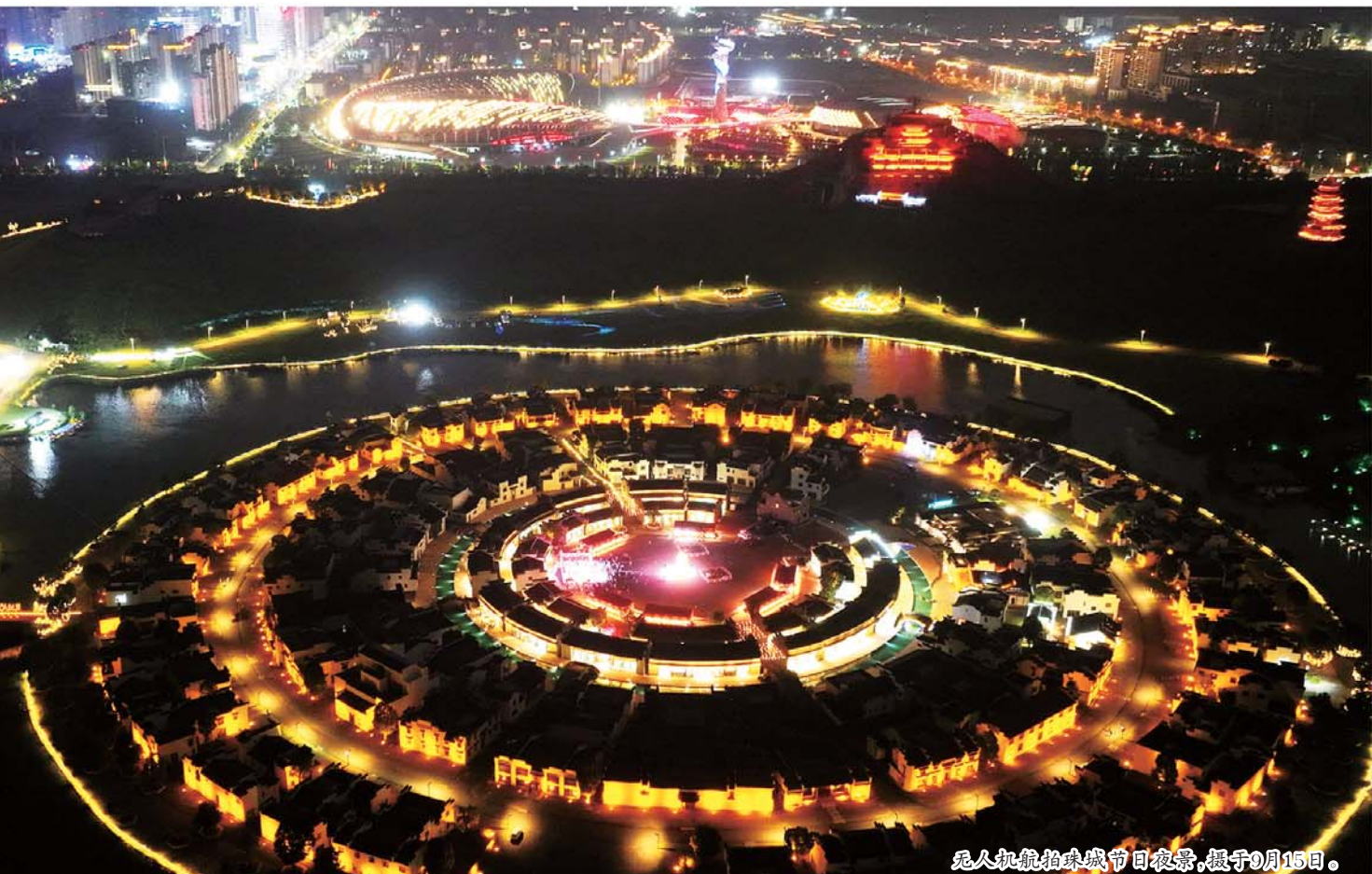
无人机航拍珠城节日夜景，摄于9月15日。