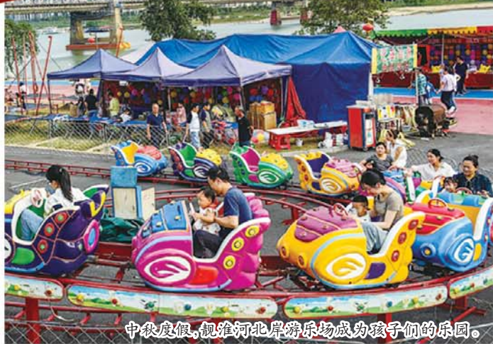
中秋度假，淮河河北岸游乐场成为孩子们的乐园。