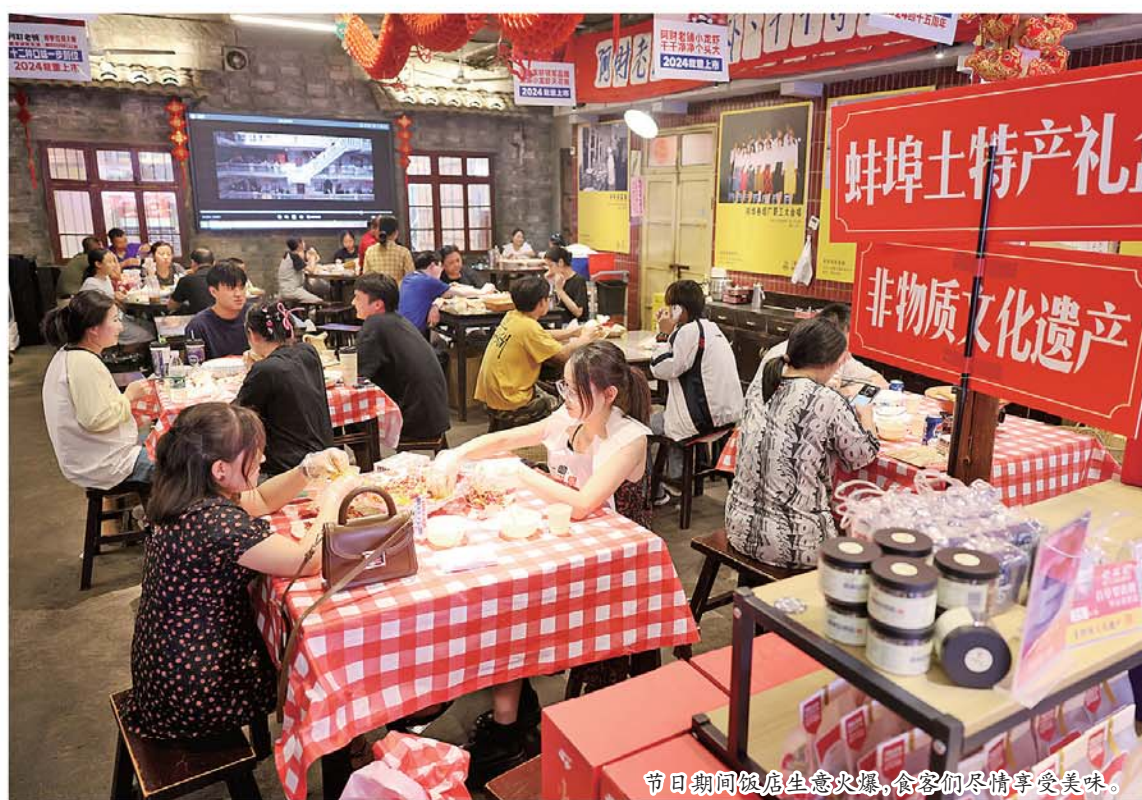
节日期间饭店生意火爆，食客们尽情享受美味。