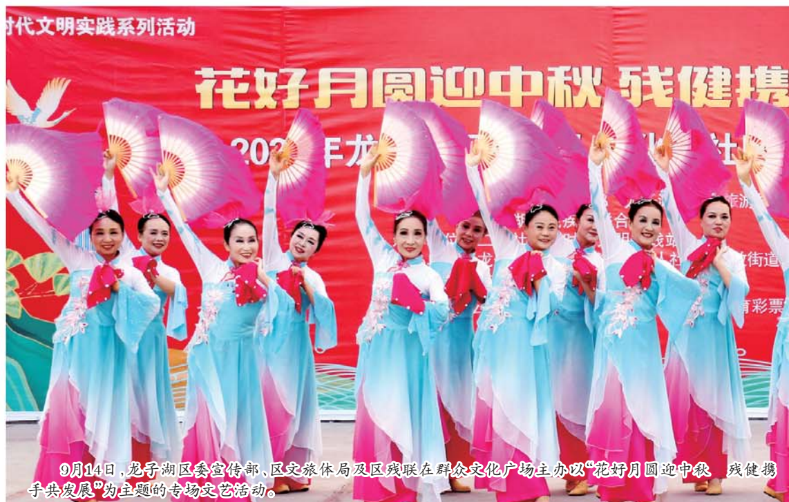
9月14日，龙子湖区委宣传部、区文旅体局及区残联在群众文化广场主办以“花好月圆迎中秋 残健携手共发展”为主题的专场文艺活动。