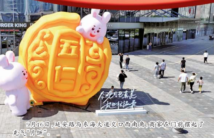
9月16日，延安路与东海大道交口西南角，商家在门前摆起了充气“月饼”。