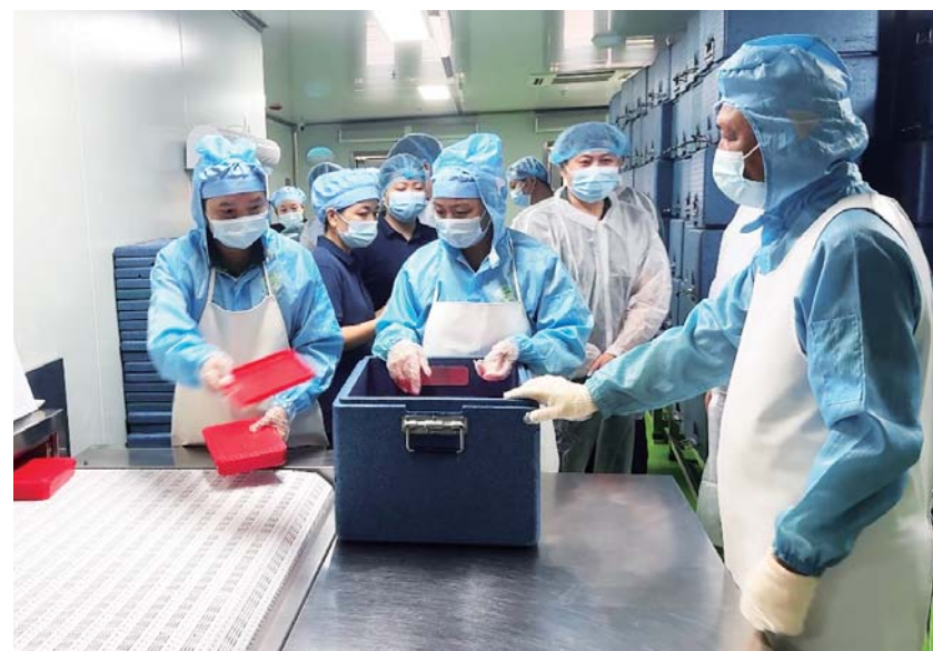
执法人员现场检查食品原材料、食品加工等环节

接下来,我市有关部门将持续坚持问题导向,加大校园食品安全监督检查力度,切实筑牢校园食品安全防线,全力守护广大师生“舌尖上的安全”,守护校园“每一餐”。