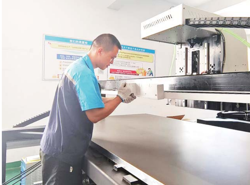
在万丽达的生产车间内工人正在调试设备。

2009年,企业初创时,设备都是从国外买的,工人们还需要根据生产需求进行手动改良。15年过去,万丽达从当初的技术依赖,到“合作借鉴”,再到如今的“自力更生”,靠的就是持续不断的创新能力。十多年来,企业的研发部门从几人扩大到近三十人,专利技术创新方面捷报频传,每一天的热辣滚烫、激情澎湃“具象化”为几万张设计图纸,几十万次测试打印,几百万行