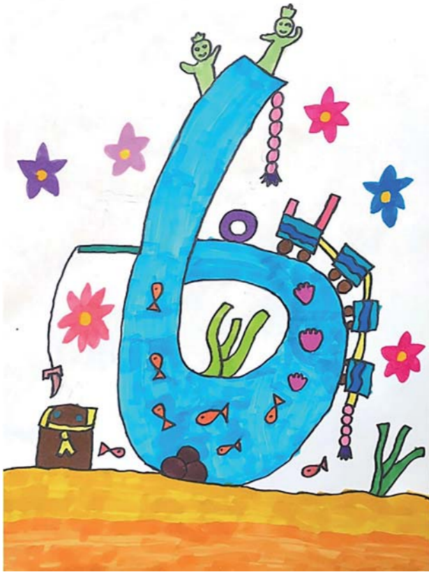
一实校汇金小学 二(3)班 郑芷琪