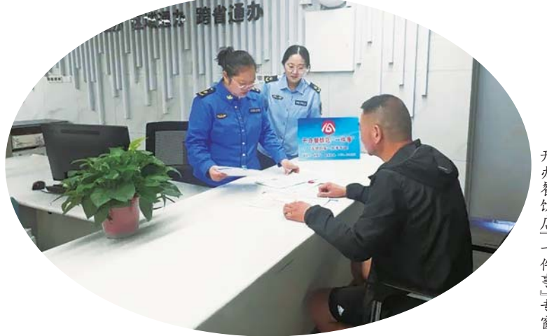
开办餐饮店“一件事”专窗。

下一步,我市将推动开办餐饮店“一件事”线上线下政务服务融合发展,引导企业和群众体验此办理模式,实现办事流程更优、办事材料更简、办事成本更小、企业群众办事体验更好,助力营商环境不断优化。