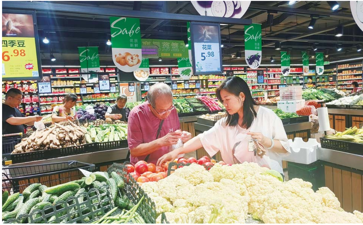
市民在华运超市银泰店挑菜。