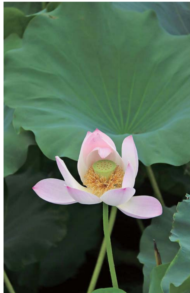
荷塘芭蕾