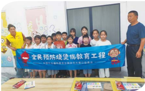
日前，长淮卫镇（西片区）民政服务站组织开展“不要烫伤我的童年”预防烧烫伤知识科普公益小课堂活动，40多名儿童参加预防烧烫伤知识学习。