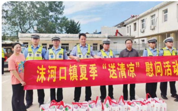
8月1日，淮上区沫河口镇深入户外工作单位开展夏季“送清凉”慰问活动，送去慰问物品和高温预防知识。