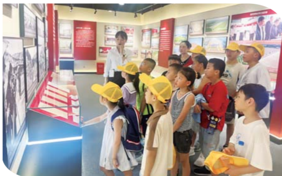
近日，金恒社区新时代文明实践站开展“金恒智慧实践篇——行走的历史课·‘忆治淮 看今朝’”活动。孩子们在了解治淮历史的过程中，感受治淮工程对当地乃至国家经济社会发展的重要意义。