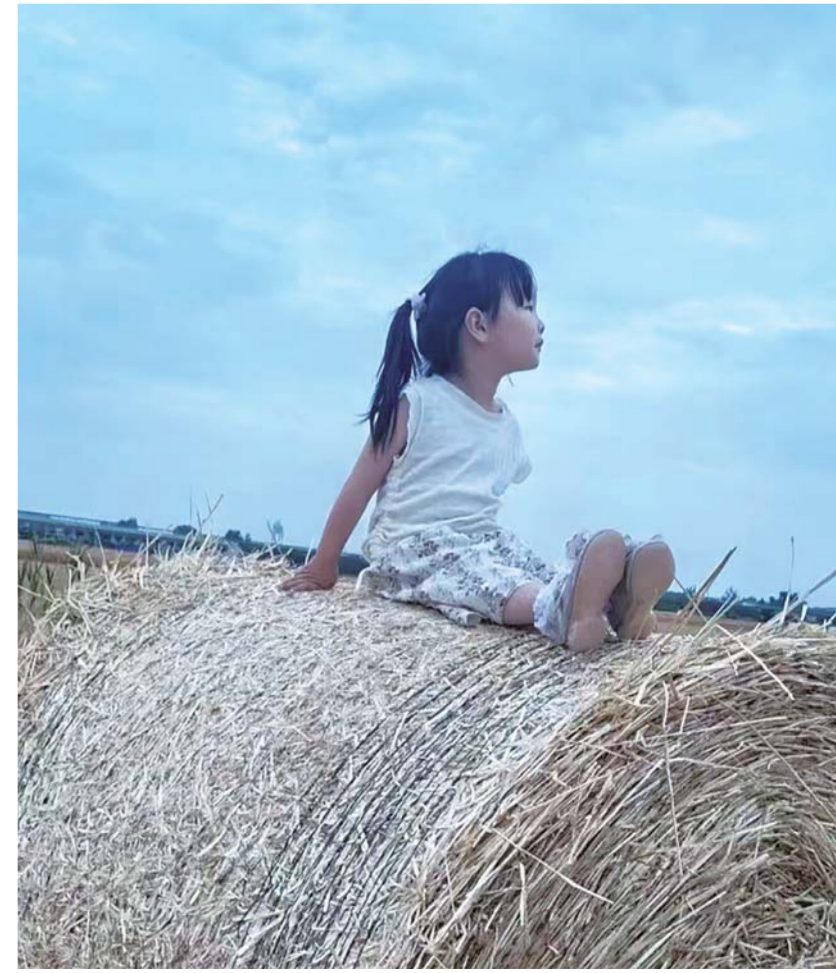
农家萌娃

在这所老年大学里，我尽管学习时间不长，但收获颇多。不但陶冶了情操，还养好了身体。这是一所德才兼备的大学，也是延年益寿的一所大学。我爱硬笔书法班，更爱我们的学校。我感恩许老师，更感恩我们的这所老年大学，它让我老有所为、老有所乐。在这里我要争做一名好学生，尽情地享受着人间乐趣，享受着国家给予的获得感和幸福感。