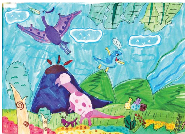
《恐龙世界》 新城滨湖学校 三(5)班 王梓熙