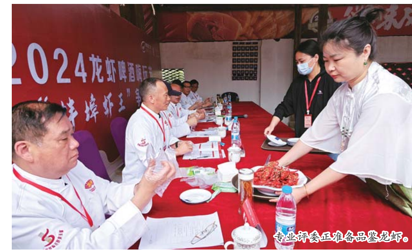
专业评委正准备品鉴龙虾。

行的是油爆龙虾组的比拼。 以虾为媒,以虾会友,近年来,我市出台一系列促进养殖业高质量发展的扶持政策,聚焦养殖产业转型升级,让养殖户在“养好虾、出好品、打好牌”的同时,发挥好“本土专家”“新农人”“行业领头人”的专家团队作用,真正实现农民增收、文旅赋能、转型升级、产业发展。 作为全国第一个“会吃虾”的城市,蚌埠将虾做到了极致,蚌埠烧虾人也带着蚌埠小龙虾走向了全国各地的餐桌。全市有近13万亩的小龙虾养殖面积,近2万吨的小龙虾年养殖产量,蚌埠小龙虾不仅成为了一条富民产业链,更成为助推农文旅高质量融合发展、推动地方社会经济高质量发展的重要抓手。