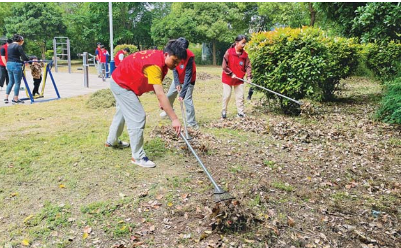
湖畔花都社区日前组织青年志愿者开展“致敬劳动·讴歌青春”主题日活动,对小区卫生死角、绿化带内的落叶、垃圾和不文明行为等进行集中整治。

加,提供岗位5100余个,吸引了近5000名求职者到场咨询了解,现场达成就业意向约400人。此外,招聘会还通过直播带岗的方式与现场活动同步进行,线上吸引约12万人次观看。 市人才中心相关负责人告诉记者,在蚌埠市第二届文化旅游美食季期间,人社部门还将举办连续10天的人才夜市活动、专场招聘会活动,让更多求职者特别是广大青年在畅游珠城美景的同时,深入感受蚌埠产业发展的勃勃生机,爱上蚌埠,留在蚌埠,为蚌埠发展提供更好的人才支撑。