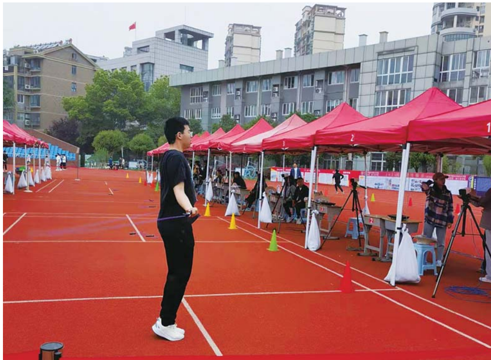
4月14日,作为考点的慕远学校操场上各种考试设备已安装就位,经过培训的考务人员正在进行跳远模拟测试。

“今年中考体育模式最大的变化是恢复到2020年之前的中考体育模式,男、女生各进行3个项目的考试,其中男生1000米/女生800米作为必考项目。”市教育招生考试院副院长吴文华介绍,根据省教育厅的统一部署,我市将2024年中考体育恢复到2020年之前的模式,即男、女生各进行3个项目的考试,其中必考项目1项,选考项目2项,总分60分。男生必考项目为1000米跑,女生必考项目为800米跑。选考项目分别为50米跑、掷实心球(2kg)、坐位体前屈、立定跳