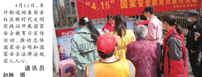
4月12日,东升街道地委宿舍社区新时代文明实践站开展国家安全教育日宣传活动,推动总体国家安全观和国家法律法规深入人心。

“消费趋势已向品种、品质、品牌转变,健康消费、品质消费、绿色消费被推崇,企业在创新探索的同时,也要重新把握消费者的认知,既满足消费者的不同需求,又引领消费变革趋势。”企业相关负责人表示,荟品仓城市奥莱将携手全球知名品牌,致力为消费者打造品质生活的一站式购物平台,助力品牌企业拓展市场、提升品牌形象及整合行业资源。