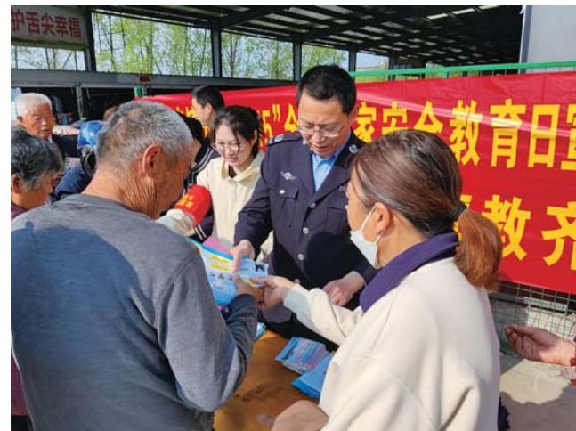
固镇县杨庙司法所、杨庙镇平安办、禁毒办等部门日前联合开展国家安全教育日宣传活动,推动国家安全意识深入人心。

提供免费医疗服务。 近年来,市卫生健康委深入学习贯彻习近平总书记关于推动长三角一体化发展的重要讲话、指示批示精神,紧扣医疗卫生“一体化”和“高质量”两个关键词,深度融入长三角,逐步实现了与沪苏浙城市从“单边融入”到“双向奔赴”的转变。此次活动为我市卫生健康事业与长三角的合作注入了新的力量,让广大群众在家门口就能享受到更加优质、高效的医疗服务。市卫生健康委将继续开展更多更便民的服务和活动,为助力蚌埠高质量跨越式发展提供健康保障。