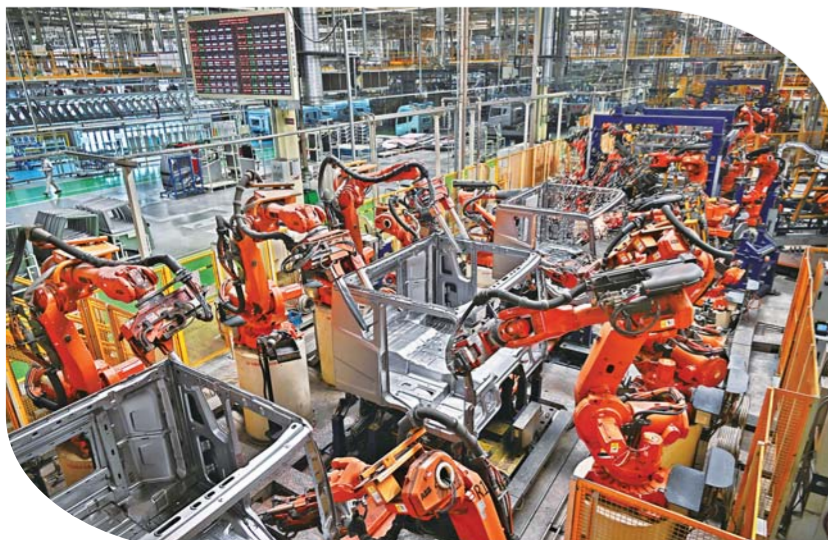
4 月 9 日，在位于青岛市即墨区的间，机器人在进行焊接作业。一汽解放青岛汽车有限公司焊装车间。