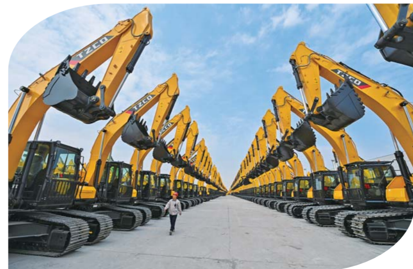
太重集团智能高端液压挖掘机产业园区内等候交付的液压挖掘机。