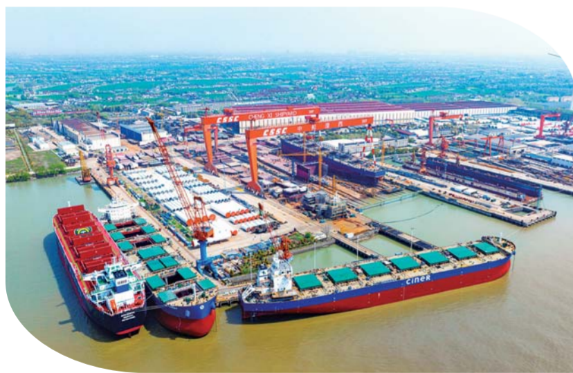
一季度，扬州市江都区造船完工量 100.23 万载重吨，同比增长 19.26%。新接订单量 61.51 万载重吨，同比增长 17.03%。