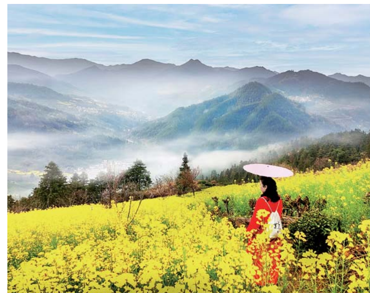
人在画中