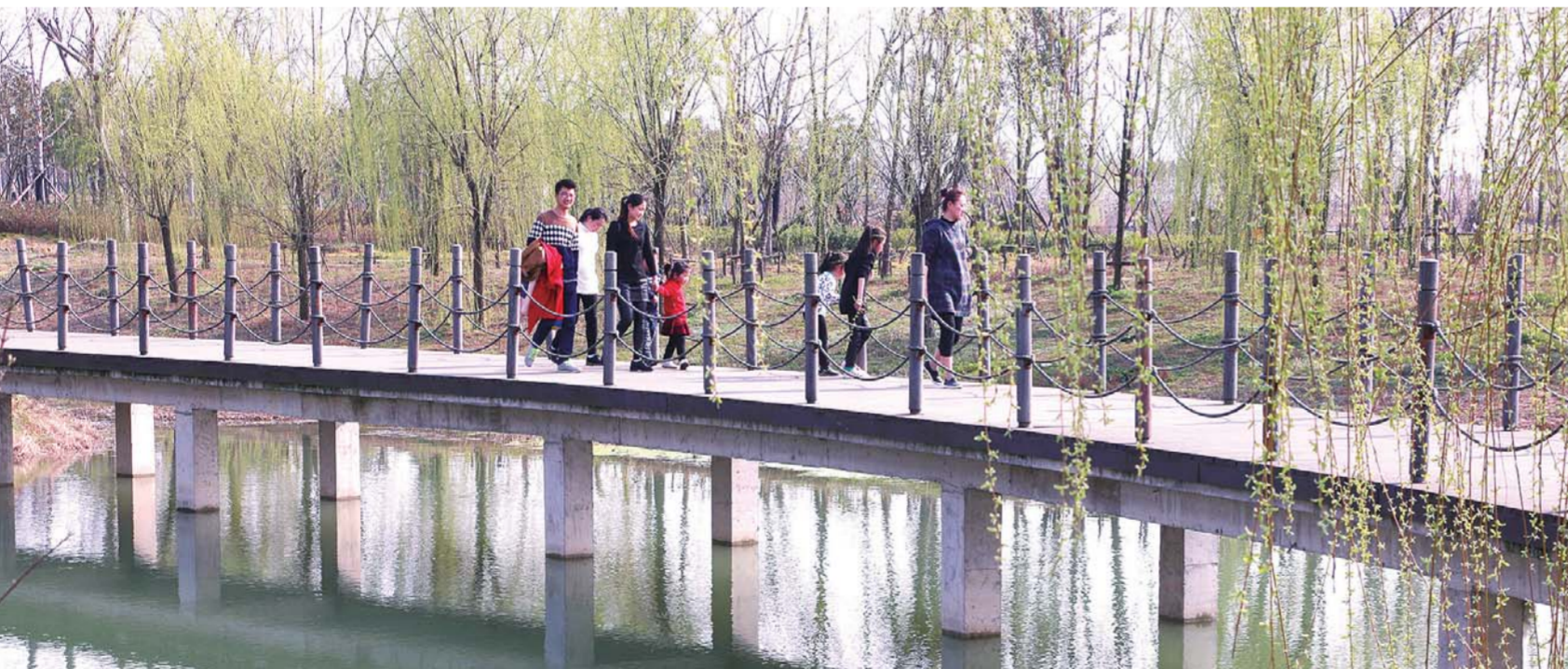
人在景中游

当前,我国数据要素市场处于快速发展阶段,应用前景十分广阔。但是,确权难、流通难、交易难等问题的存在严重制约着我市数据要素市场的高质量