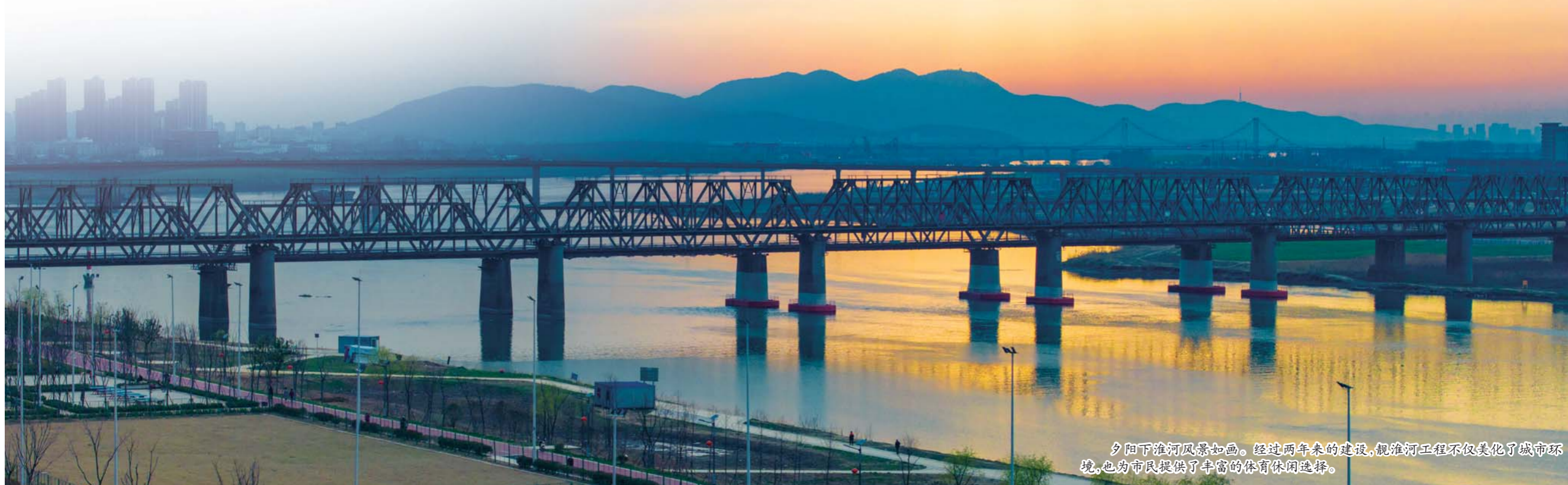
夕阳下淮河风景如画。经过两年来的建设,观淮河工程不仅美化了城市环境,也为市民提供了丰富的体育休闲选择。