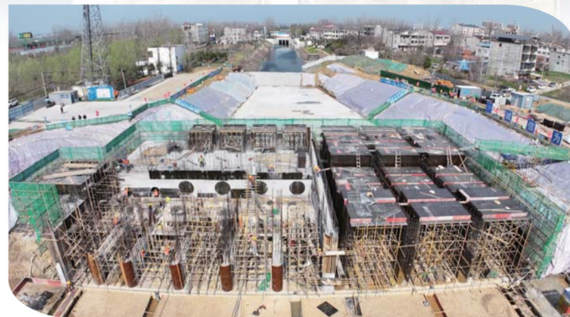
怀洪新河灌区工程四方湖灌区和淝湖灌区(怀远县境内)将建设12座泵站,12个节制闸,4条干渠,2条大沟,4座渡槽,22座农桥,39座放水闸,建成后可提高当地的灌溉水源和防洪能力。