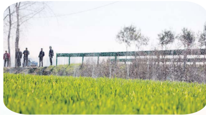
3月15日,怀远县仁和村,农民利用临近的农田灌溉机电井对农作物进行适时补水。