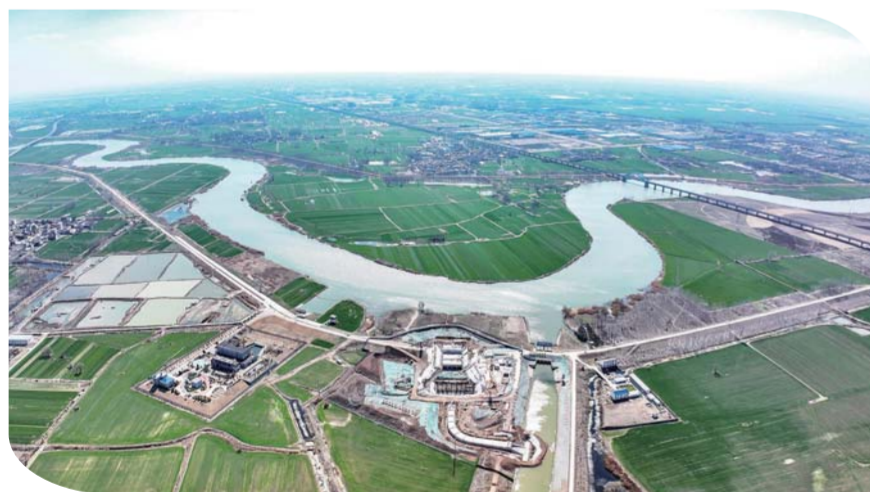
怀洪新河淝湖灌区(一期)固镇县境内工程,主要建设内容包括淝湖灌区一级翻水站刘园站和马拉沟中片、马拉沟西片、青龙闸片、珍珠沟片和淝北片等五个片区的工程。