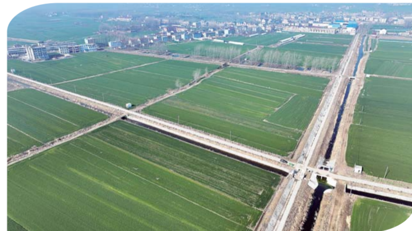
建设于怀远县中肥村的防冲渠,进一步助力周边高标准农田增产增效。