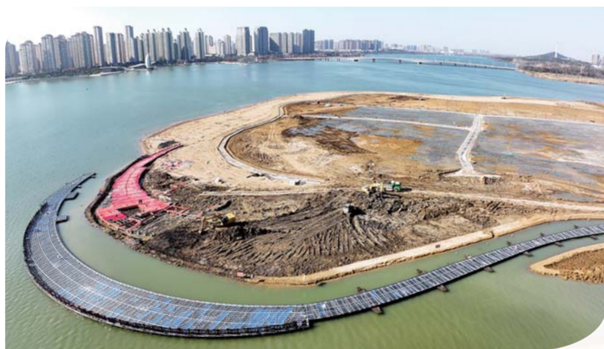
备受市民关注的龙子湖“国家级幸福河湖”项目进展迅速,目前园区内金沙滩铺设、龙鳞叠水、园区内沟渠水系、浮桥主体已完成。