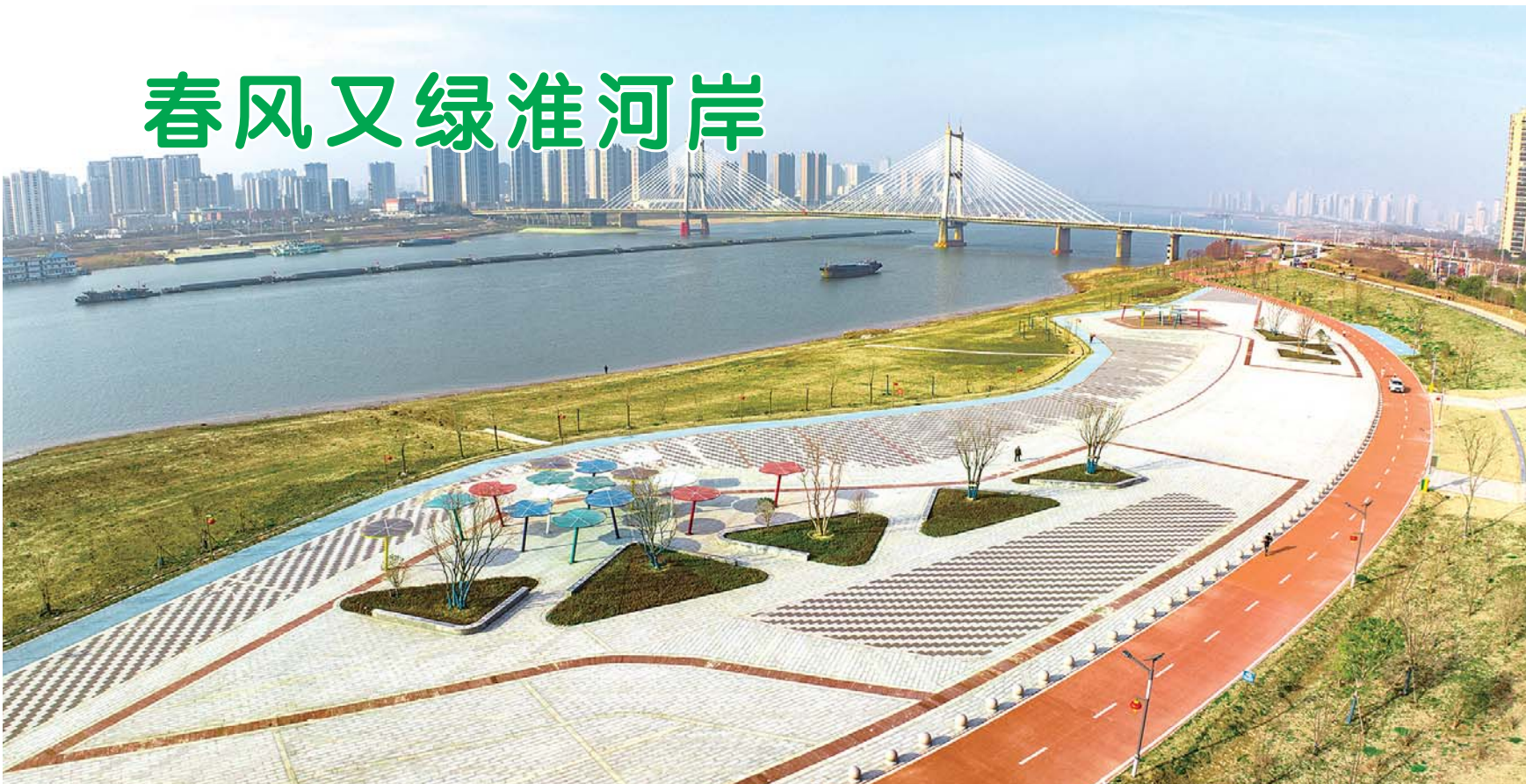
最美阳春三月天,春风又绿淮河岸。近日,淮河北岸东段观淮公园小草萌发,春意盎然,淮河水运繁忙,好一幅淮岸春景图。