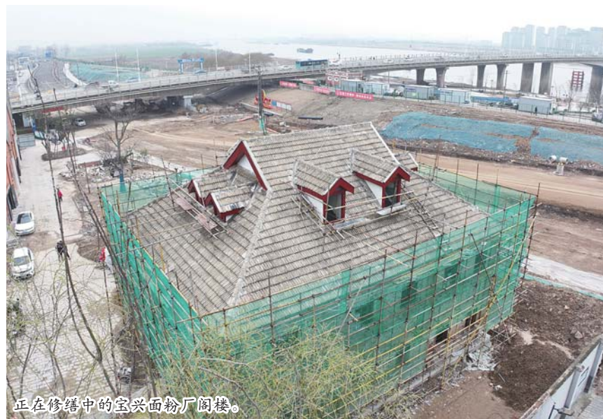
正在修缮中的宝兴面粉厂阁楼。

满足我市春耕生产需要。农业相关部门常态化对制种企业种子生产经营许可、种子生产备案、品种真实性、种子质量控制等方面进行检查,提升保供保障能力。 “保障粮食和重要农产品稳定安全供给始终是头等大事。”市农业农村局种植业管理科负责人表示,入春以来,全市上下强化要素保障支撑,积极抢抓农时,主动靠前服务,进一步加强田间管理,为夏粮丰收打好产架子。下一步将根据春季气候特点,因地因苗精细管理,做到分类施策,科学肥水促弱苗、控旺苗、转壮苗,认真做好小麦“一喷三防”准备,为夏粮丰收打下基础。