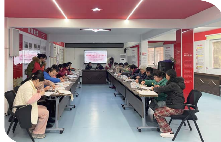
3月5日,红旗社区新时代文明实践站开展“春意融融女神节 巧手慧心美生活”手工DIY帆布包活动,为辖区妇女同胞提供一个学习交流的平台,增强她们的幸福感和满意度。