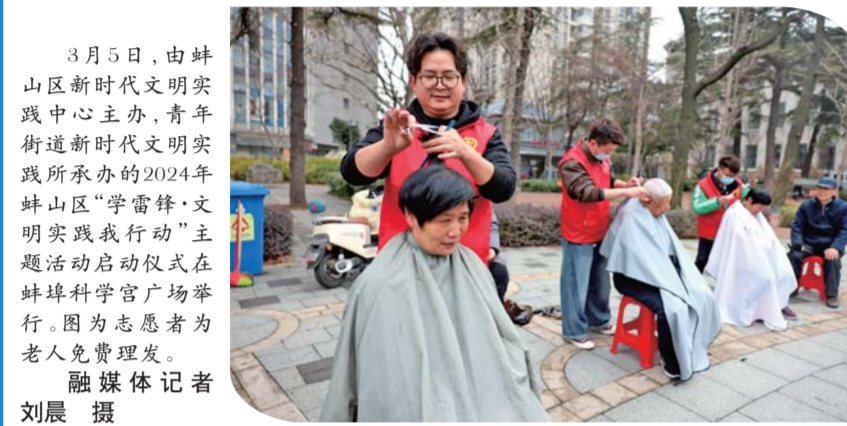
3月5日,由蚌山区新时代文明实践中心主办,青年街道新时代文明实践所承办的2024年蚌山区“学雷锋·文明实践我行动”主题活动启动仪式在蚌埠科学宫广场举行。图为志愿者为老人免费理发。