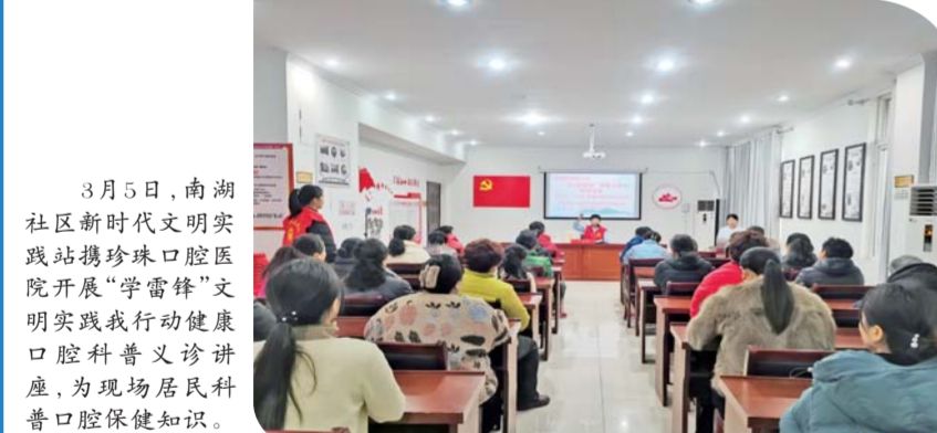
3月5日,南湖社区新时代文明实践站携珍珠口腔医院开展“学雷锋”文明实践我行动健康口腔科普义诊讲座,为现场居民科普口腔保健知识。