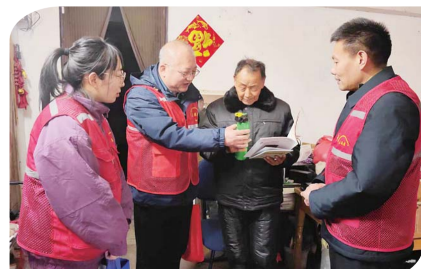
3月4日下午,蚌埠市军培中心组织原蚌埠消防救援支队自主择业军转干部赴钓鱼台街道开展消防知识进社区志愿活动,提高广大群众消防意识和居家安全隐患自查能力,构筑社区安全屏障。

位安徽皖中律师事务所的志愿者为群众普及生活中的法律常识,解答群众法律的相关问题;睦邻友善志愿服务队志愿者的身边放满群众带来的刀子剪子、电动磨刀器一刻不得闲;志愿者主动宣传电瓶车火灾防范等和居民生活息息相关的知识。 纬二路街道相关负责人表示,街道将持续开展多样的志愿服务活动,凝聚志愿服务力量,在志愿者与广大群众之间搭好连心桥。