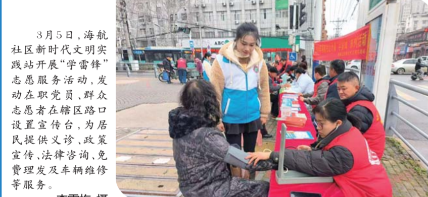
3月5日,海航社区新时代文明实践站开展“学雷锋”志愿服务活动,发动在职党员、群众志愿者在辖区路口设置宣传台,为居民提供义诊、政策宣传、法律咨询、免费理发及车辆维修等服务。