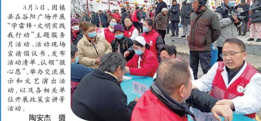
3月5日,固镇县在谷阳广场开展“学雷锋·文明实践我行动”主题活动。活动现场宣读倡议书、发布活动清单,认领“微心愿”、举办交流展示和文艺演出活动,以及各相关单位开展政策宣讲等活动。