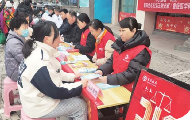
3月6日,地委宿舍社区新时代文明实践站联合中国银行淮南路支行、蚌医大一附院、蚌滨社区淮滨小帮办、蚌滨供电公司等,开展“弘扬雷锋精神争当社区先锋”在职党员进社区志愿服务月主题活动,为群众提供义诊等志愿服务。