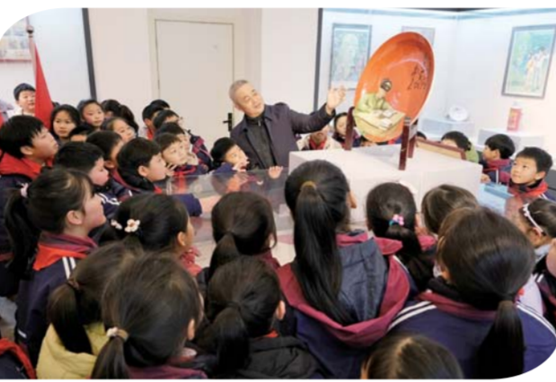
连日来,五河县分赴组织万名中小学生走进雷锋纪念馆,聆听雷锋故事,弘扬雷锋精神,引导学生树立正确的世界观、人生观、价值观。图为3月5日,五河县实验小学学生在县雷锋纪念馆参观学习。