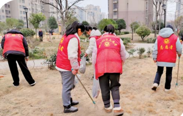
近日,湖山区新时代文明实践站组织志愿者开展“文明实践我行动”美化环境清洁家园志愿服务活动,引导更多居民参与学雷锋活动,传承雷锋精神,营造良好的社会氛围。