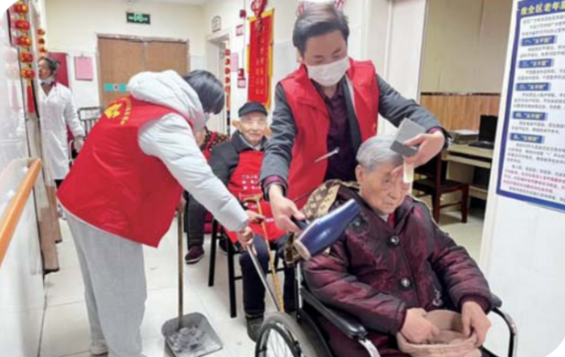
在第61个学雷锋纪念日到来之际,东升街道淮滨社区淮滨小帮办志愿者联合安徽省淮河流域管理局、怀洪新河河道管理局志愿者,来到华康养老院看望慰问老人,打扫卫生、为老人理发,以实际行动践行志愿服务精神。