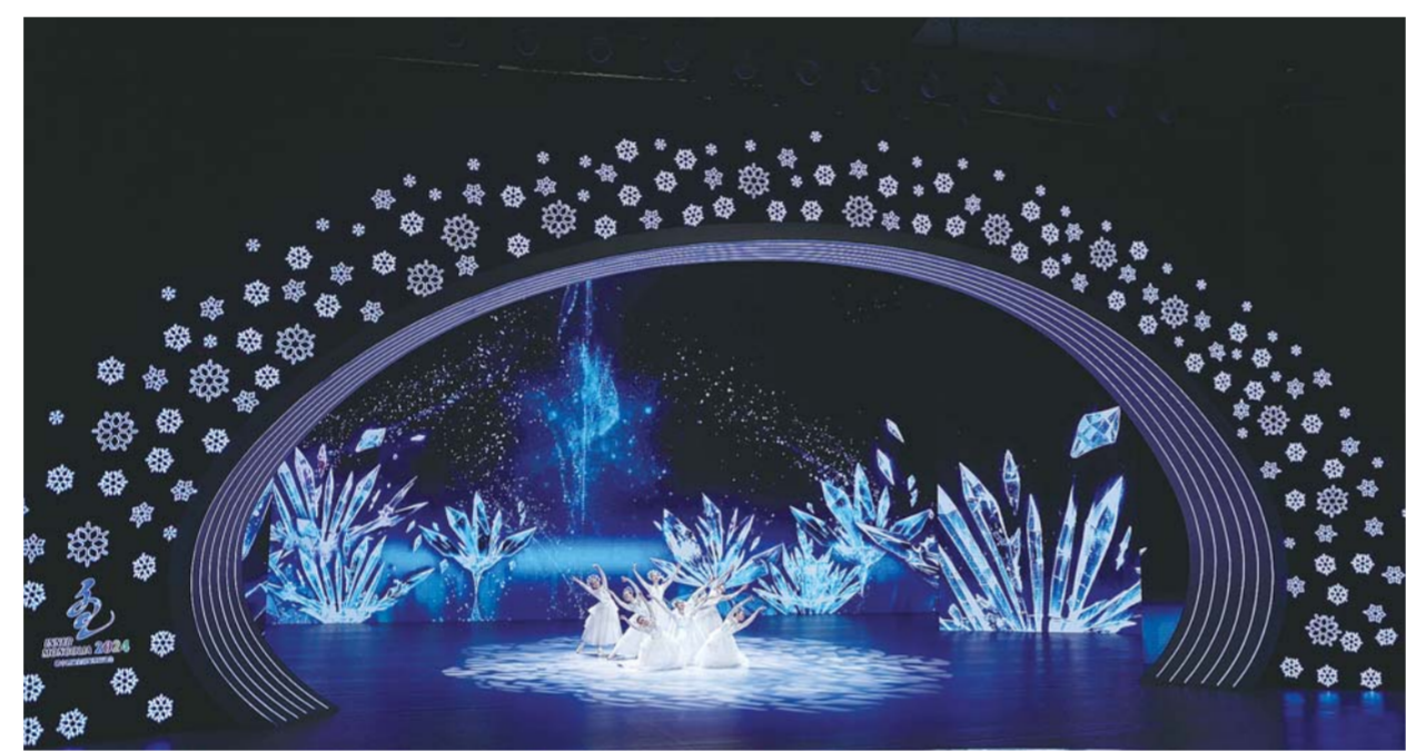
2月27日,演员在闭幕式上表演。当晚,第十四届全国冬季运动会闭幕式在内蒙古呼伦贝尔市举行。

176——“十四冬”竞赛比赛设滑冰、滑雪、冬季两项、冰壶、冰球、雪车、雪橇、滑雪登山8个大项、16个分项、176个小项,第一次全面对标冬奥会设项。雪车、雪橇、滑雪登山等项目均是首次在全冬会设项,为运动员提供了更多实战练兵机会。短道速滑、空中技巧等传统重点项目梯队建设日益完备;北京冬奥会周期发展起来的大跳台、坡面障碍技巧、障碍追逐等新兴项目,呈南北并进、多点开花局面;基础大项越野滑雪、高山滑雪青年组比赛