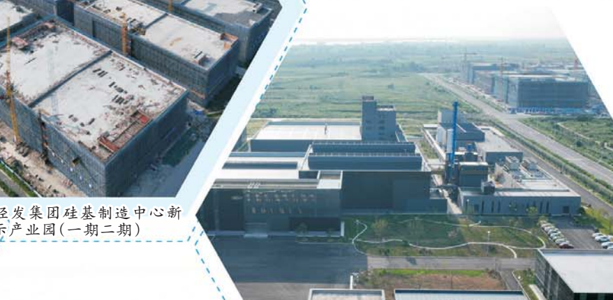
经发集团硅基制造中心新型显示产业园（一期二期）