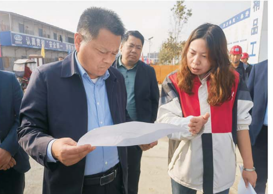
调研重点项目建设情况