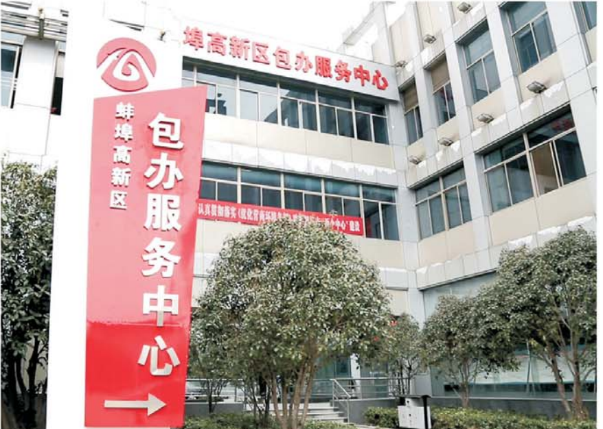
高新区包办服务中心