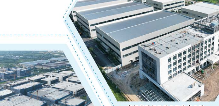
高投集团新型显示配套产业园