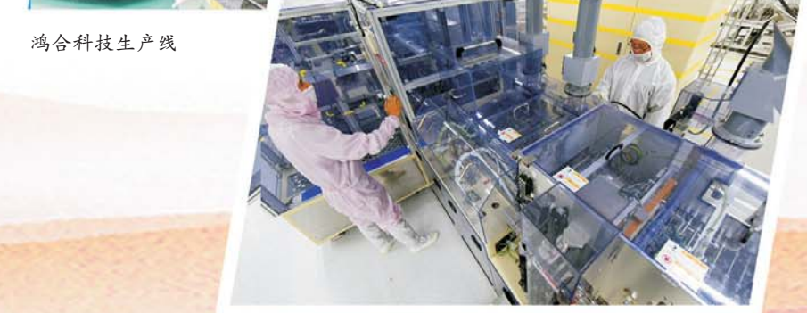
蚌埠国显科技液晶显示模组项目生产车间