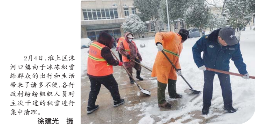
2月4日,淮上区沫河口镇由于冰冻积雪给群众的出行和生活带来了诸多不便,各行政村纷纷组织人员对主次干道的积雪进行集中清理。