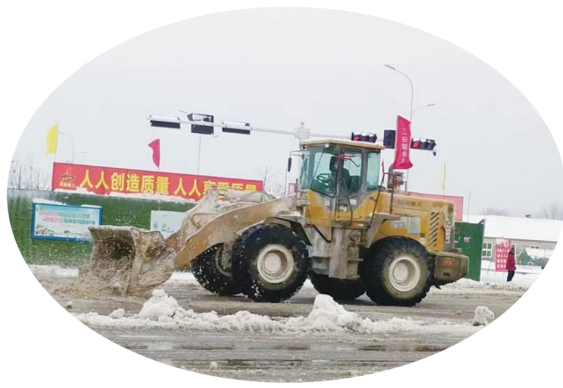
及时除雪,保障重点路段畅通。

本报讯 (融媒体记者 周芳林 通讯员 高洁 文/图)大雪来袭,经开区以雪为令,迎寒而上,迅速投入除冰雪、保安全、保稳定工作中,积极采取措施应对恶劣天气,全力保障人民群众生命财产安全和生产生活秩序。 2月3日上午,经开区召开雨雪天气应对工作会议,调度应急响应开展情况,对主干道小区除雪、困难群众摸排保障、重点区域安全隐患排查等工作提出明确要求。相关部门、单位迅速行动,采取有效措施,全力保障群众生产生活平稳有序。 重点加大中环线、长淮卫淮河大桥等重点路口、路段的巡逻管控和指挥疏导力度,组织应急队伍49人,对中环线下穿、凤阳东路桥面等重要路段开展融雪除冰作业,撒融雪盐12.18吨,清扫道路积雪约15公里。 为保障生产生活秩序稳定,经开区