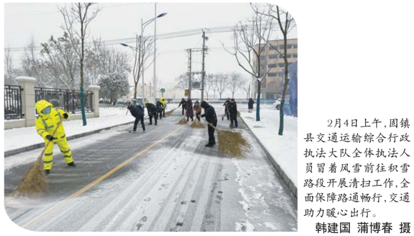
2月4日上午,固镇县交通运输综合行政执法大队全体执法人员冒着风雪前往积雪路段开展清扫工作,全力保障道路畅通,交通助力暖心出行。

保营商环境通道畅通。 “现在已有1200多名物业从业人员参与除雪防冻工作,调配了4台铲雪车和其他机械车辆在路面开展作业。”高新区综合执法局物业管理办公室(下称“区物业办”)副主任朱刚告诉记者,2月2日以来,全区住宅物业小区组织保安、保洁、客服等物业人员,扫除积雪、清除冰层、撒融雪剂、铺防滑垫、设置警示提醒标识,为保障小区居民上班出行开辟了一条安全的“绿色通道”。 面对持续的降雪以及可能出现的低温冰冻风险,区物业办第一时间向全区物业企业下发工作通知和温馨提示,要求物业企业严格落实人民群众安全高于一切的服务宗旨,启动应急预案,准备应急物资,防范低温冻坏水管、消防救援等公共设施,做好小区路面防冻、防滑措施。 “目前已重点对物业管理区域各类设施管线、地下车库出入口、电梯照明等关键部位进行巡检排查,确保各类设施设备正常运行。同时加强值班值守,及时回应解决居民求助,确保群众正常生产生活。”朱刚表示。