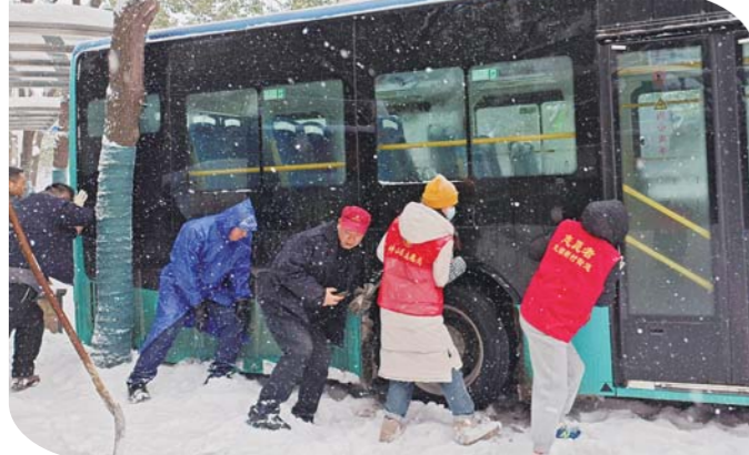
2月1日-4日期间,蚌埠市出现连续强降雪,龙湖新村街道全面开展除雪保通行、应急值守、保障困难居民生活等工作。