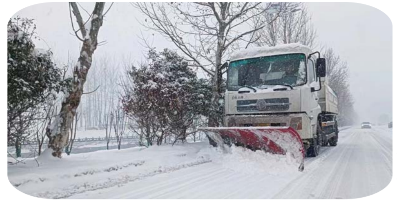
铲雪现场。截至2月4日16时,全市公路系统已出动人员1300余人次,各类除雪设备238台次,撒布融雪剂700余吨、防滑料5吨。此时,距蚌埠公路冰雪天气应急预案启动已持续74个小时,配备的是137人的应急队伍,34台套应急设备,意味着每名应急人员每日工作平均时长达10.6个小时,而保障市区跨淮大桥的直属公路分中心的应急人员平均时长更达17个小时。