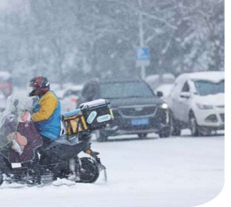
2月4日,淮上区沫河口镇由于冰冻积雪给群众的出行和生活带来了诸多不便,各行政村纷纷组织人员对主次干道的积雪进行集中清理。