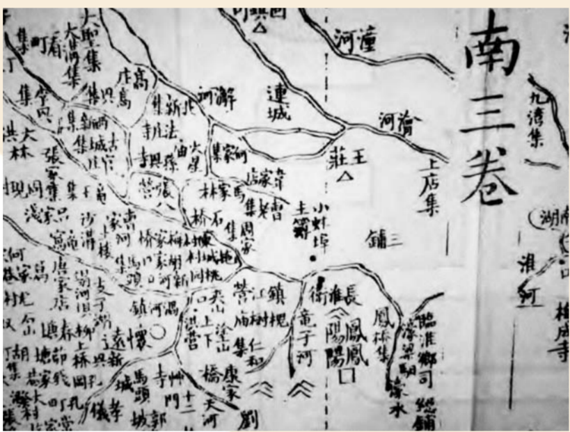
同治二年(1863)刻《大清壹统舆图》南三卷(局部)，在淮河北岸小蚌埠方位标有“小蚌埠主簿”字样。(图二)

而原先对小蚌埠之域享有管辖权的灵璧县，显然认为凤阳县的这种做法已触及本县底线，拒不接受，不仅在官修县志中仍坚持将小蚌埠之域(灵璧称之为“蚌步集”)划归本县版图，还分别向凤阳府(知府为从四品)、分巡庐凤道(正四品，负责监管皖北府州县的官员，驻凤阳府城，参见《乾隆江南通志》卷一百零六、《光緒重修安徽通志》卷一百一十二)甚至安徽省衙申诉凤阳县的“侵权行为”，要求上层官府主持公道。