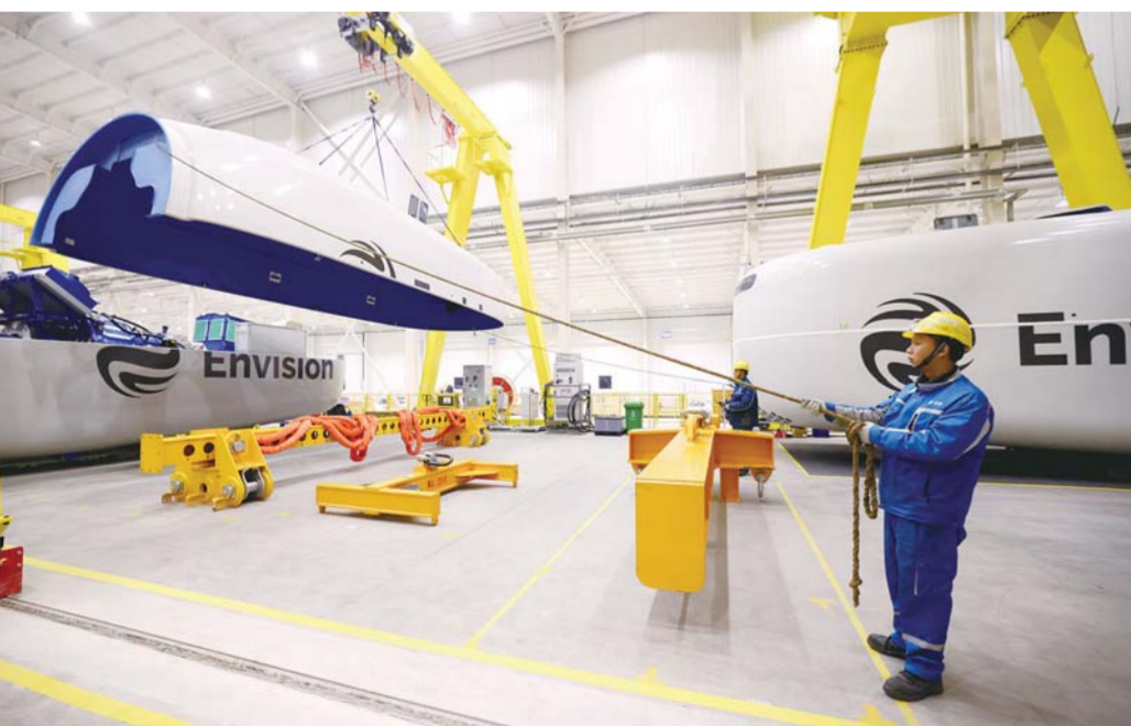
远景五河智能风机装备制造和智慧储能装备制造项目为打造我市零碳企业、零碳园区奠定基础。