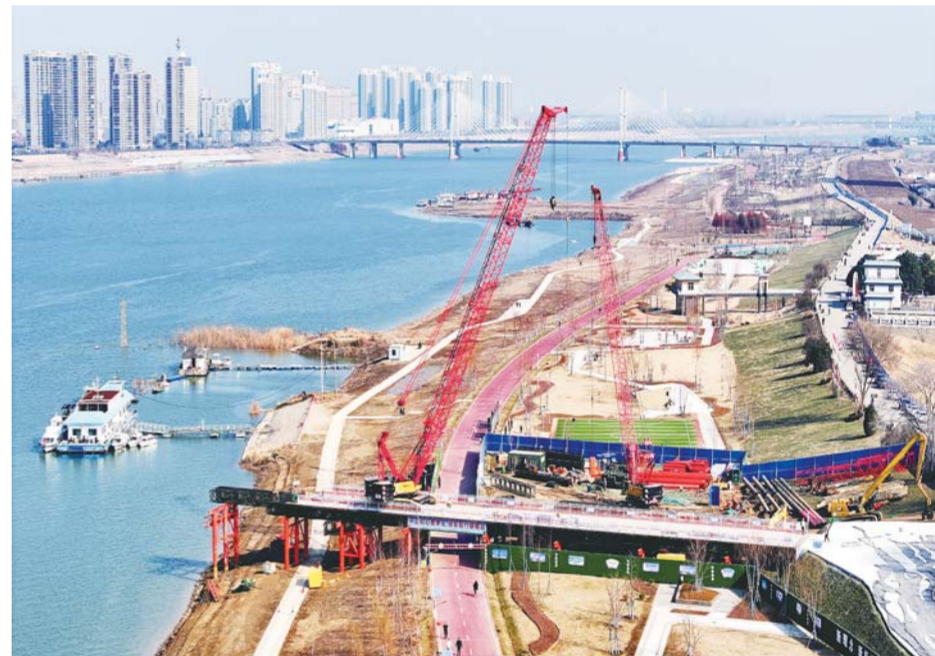
延安路淮河大桥施工现场。

2023年,我市以习近平新时代中国特色社会主义思想为指导,全面贯彻落实党的二十大精神,坚持“改作风、优环境,抓招商、推创新,增投资、建项目,惠民生、创幸福”工作主线,坚定信心、埋头苦干,主动作为、攻坚克难,推动经济持续回升向好,高质量跨越式发展迈出更加坚实步伐,现代化幸福蚌埠建设取得一系列新进展新成效。