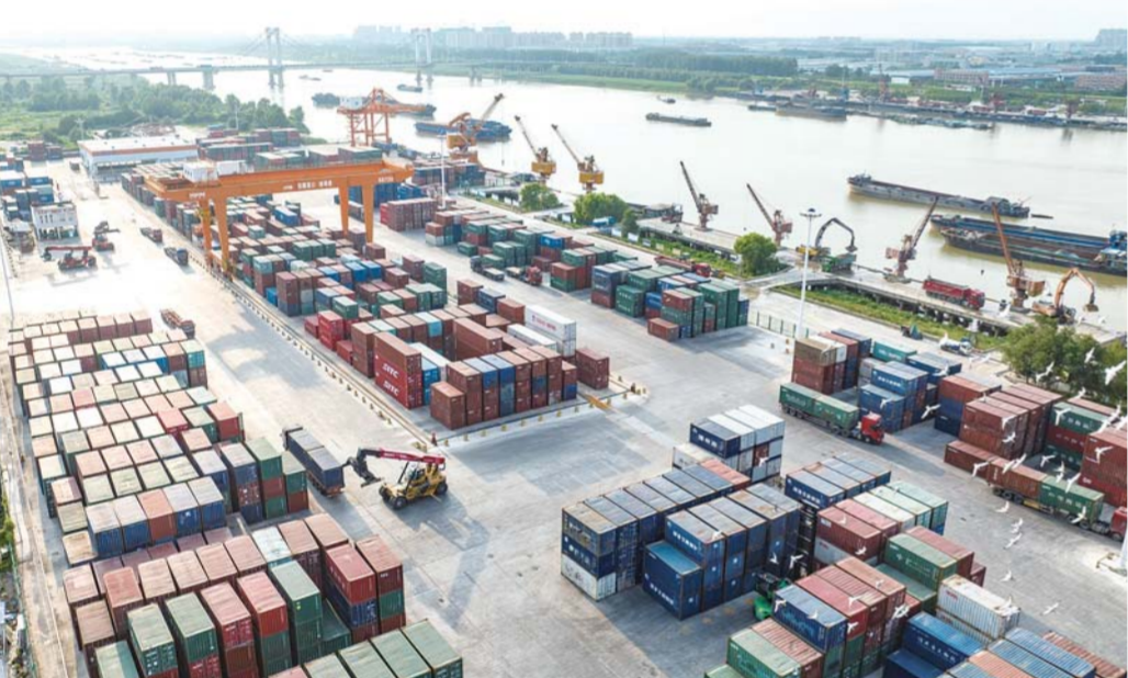
蚌埠港国际集装箱码头一片繁忙景象。