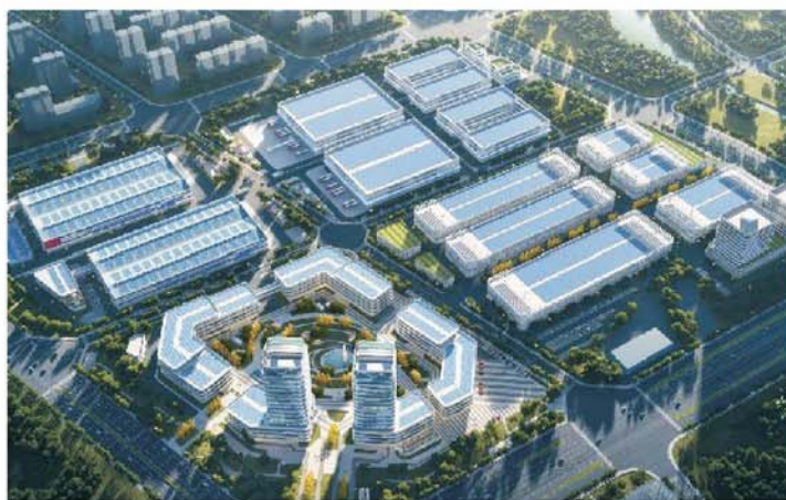
中国·蚌埠天空智造产业园

2023年禹投集团继续与市场深度接轨,推进集团市场化转型发展。目前公司相继开展了港口物流、生态养殖、国际贸易、供应链金融及物业管理等市场化业务,2023年预计实现市场化业务收入约3.5亿元,有效提高了集团财务现金流,改善了财务收入结构。