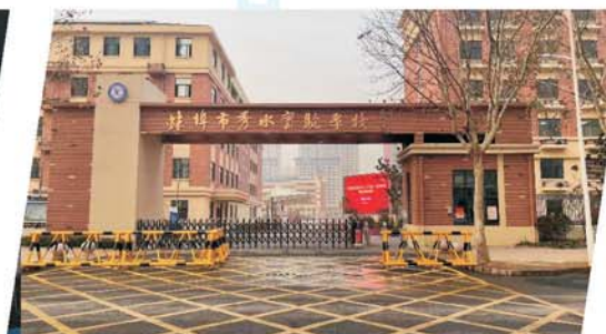
蚌埠市秀水实验学校