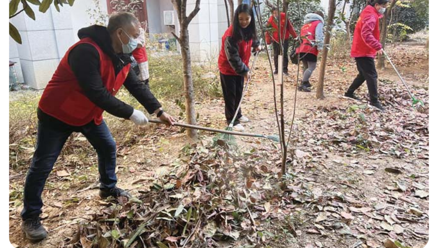
万荣社区新时代文明实践站日前组织辖区在职党员、志愿者开展“清洁家园 你我同行”环境卫生整治志愿服务活动。

“我们将把此次评议与自身建设相结合，对评议中收集到的意见建议及时归纳总结，真正化评议为动力，实现解难题、促发展、树形象。”市自然资源和规划局党组书记、局长李坤圣表示，市自然资源和规划局将自觉接受人大监督，以为企为民服务为根本宗旨，持续深化作风和效能的推陈出新，确保高质量完成全年各项目标任务。