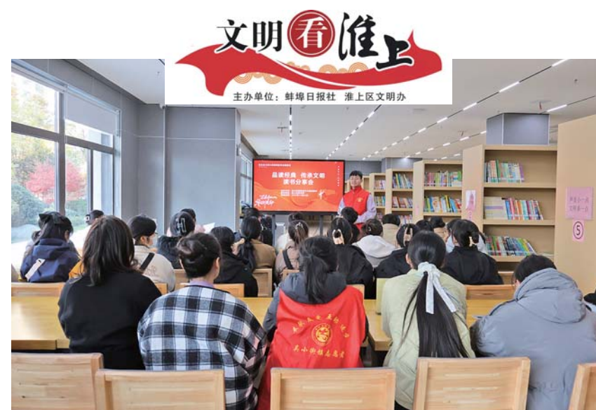
日前,吴小街镇新时代文明实践所联合淮上区图书馆开展“品读经典 传承文明 读书分享会”社会主义核心价值观主题教育活动,增强辖区文化氛围,激发居民读书兴趣。

如何满足消费者对婚庆消费的新需求,拓宽“婚嫁+文旅”市场消费前景?杨天才介绍,“一站式”服务不仅是婚庆消费的新业态,更是市场的主流趋势。在未来3年内,将深入推动婚庆产业链上下游企业形成产业聚合,打造蚌埠唯一一家有关婚嫁服务的全维度、三位一体化、产业链项目集团公司,推进打造克拉宝格丽婚嫁城。将龙子湖、张公湖、中国蚌埠古民居博览园、禹王宫等具有蚌埠特色的地标性建筑、景点融入婚嫁市场,进一步营造蚌埠“浪漫经济”新生态。以高品质婚嫁服务体系打造全新婚嫁旅游目的地,围绕市场需求策划婚嫁主题旅游线路产品、打造精品婚嫁文化IP,形成婚庆产业的集聚,激发蚌埠文化旅游消费潜力。克拉宝格丽婚礼艺术中心将以过硬的实力,将自身打造成为蚌埠幸福文化产业消费聚集地,进一步打造辐射皖北、影响安徽、走向全国的全新的婚嫁婚庆服务模式。