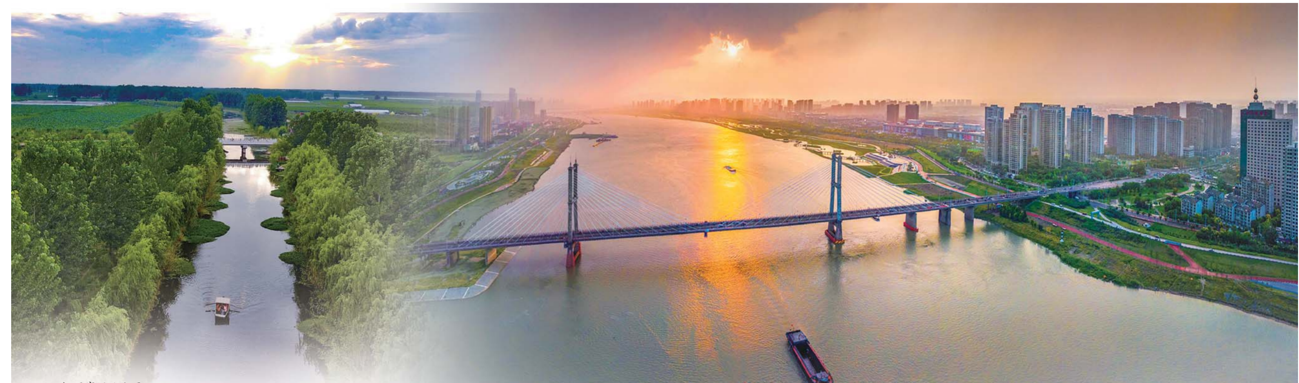
三汊河国家湿地公园