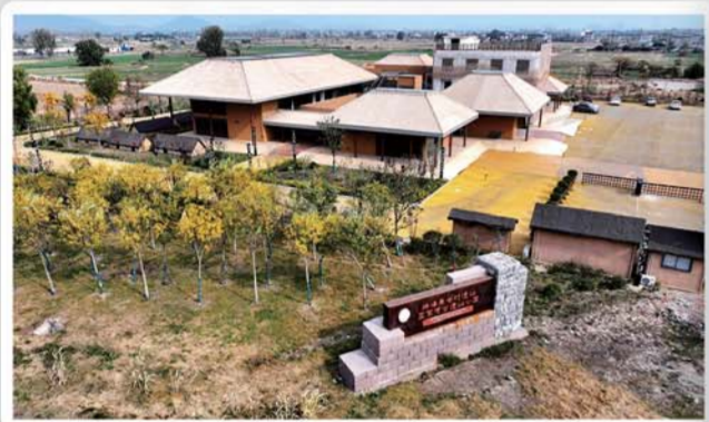
禹会村遗址国家考古遗址公园