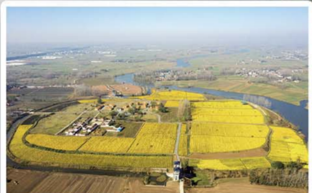
固镇垓下遗址公园