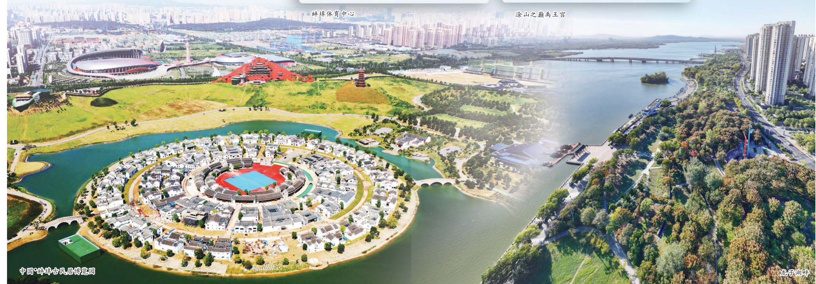
中国·蚌埠古民居博览园