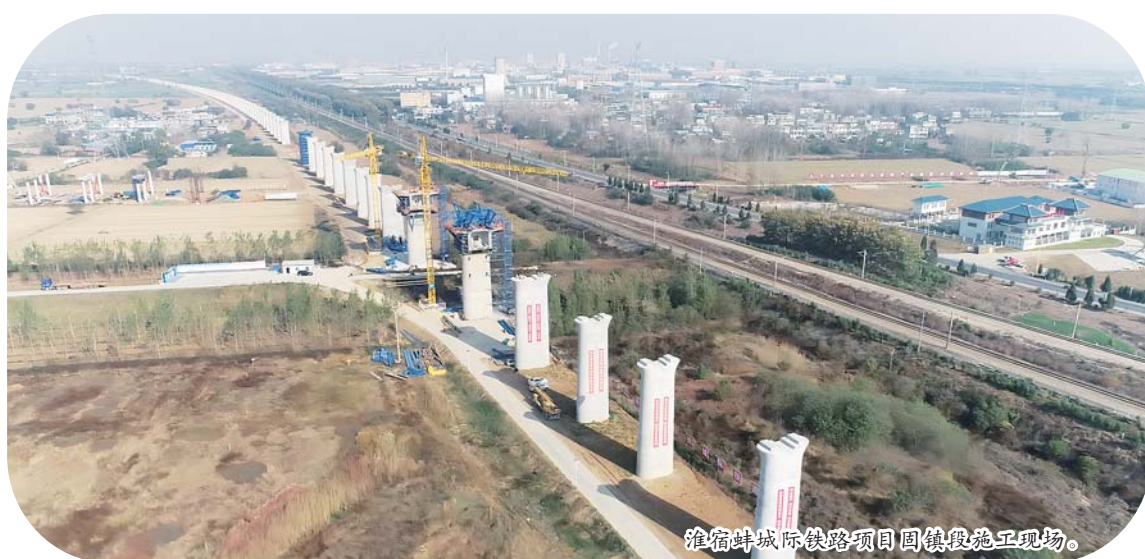
淮宿蚌城际铁路项目固镇段施工现场。

本报讯 （宋良玉 祝肖俊 文/图）近日，笔者在全省重点铁路项目——淮宿蚌城际铁路项目固镇段建设现场看到，全线钻孔桩完成99.69%、管桩完成100%、承台完成96.93%、墩台完成95.36%，已完成投资约43亿元，预计2024年春节前完成蚌埠北特大桥墩身施工任务。 作为淮宿蚌城际铁路横跨怀洪新河的重要工程的蚌埠北特大桥，是这一项目的重难点工程。眼下正是怀洪新河的枯水季节，在保障怀洪新河生态不受影响情况下，建设者们加班加点，抢抓工期，对锁扣钢管桩进行接长焊接，确保材料和工期相匹配，为后续承台和墩身施工建设做好衔接准备。目前，在施栈桥墩内打桩68根，浇筑桥墩8座，保障100米连续梁建设，主墩钻孔桩施工已基本完成，2024年春节前将完成蚌埠北特大桥的墩身施工。