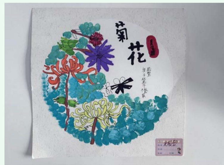
学海路学校 五(3)班 吴俊哲