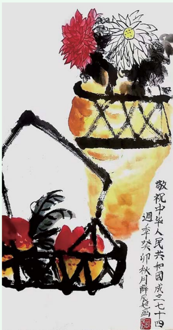
蚌山小学 六(6)班 小记者 薛辰旭 指导教师:沈西全