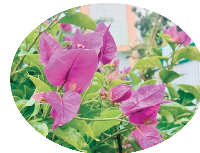
赏心悦目