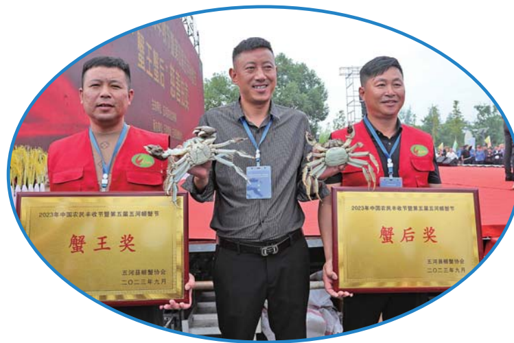
“蟹王”“蟹后”新鲜出炉。