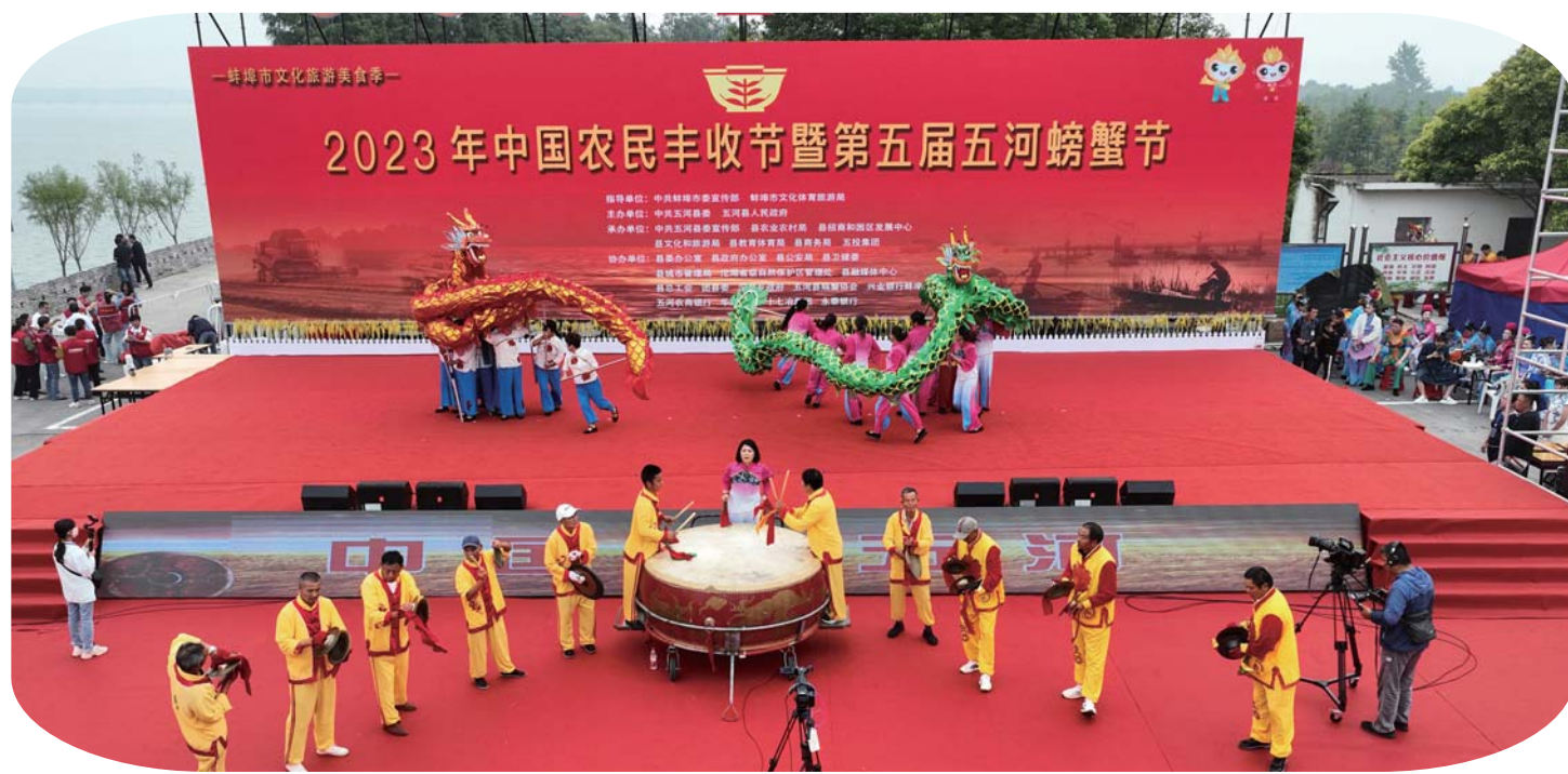
9月28日上午，五河县举行2023年中国农民丰收节暨第五届五河螃蟹节活动。