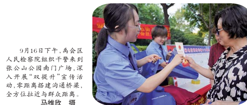
9月16日下午,高会区人民检察院组织干警来到张公山公园南门广场,深入开展“双提升”宣传活动,零距离搭建沟通桥梁,全方位拉近与群众距离。