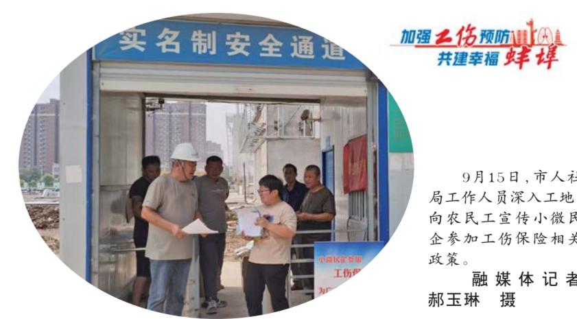
9月15日,市人社局工作人员深入工地,向农民工宣传小微企业参加工伤保险相关政策。