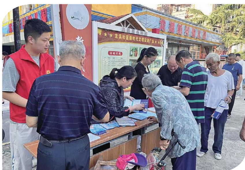
近日,蚌山区龙湖新村街道人大工委组织部分工委委员、人大代表,多次到幼儿园门口和社区广场等居民较多的地方进行反诈知识宣传活动,以发生在我们身边的案例做教材,引导居民加强对预防网络诈骗的重视度。