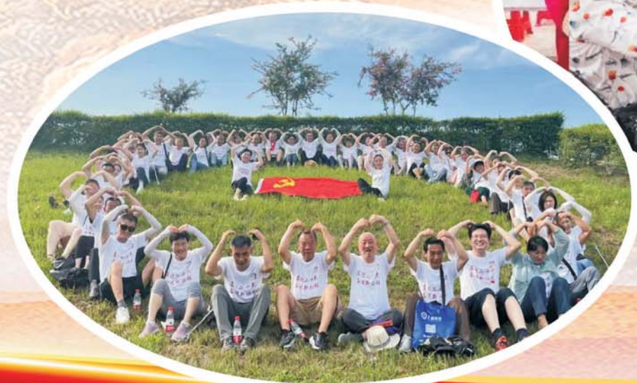
蚌埠融媒记者 李景 采写